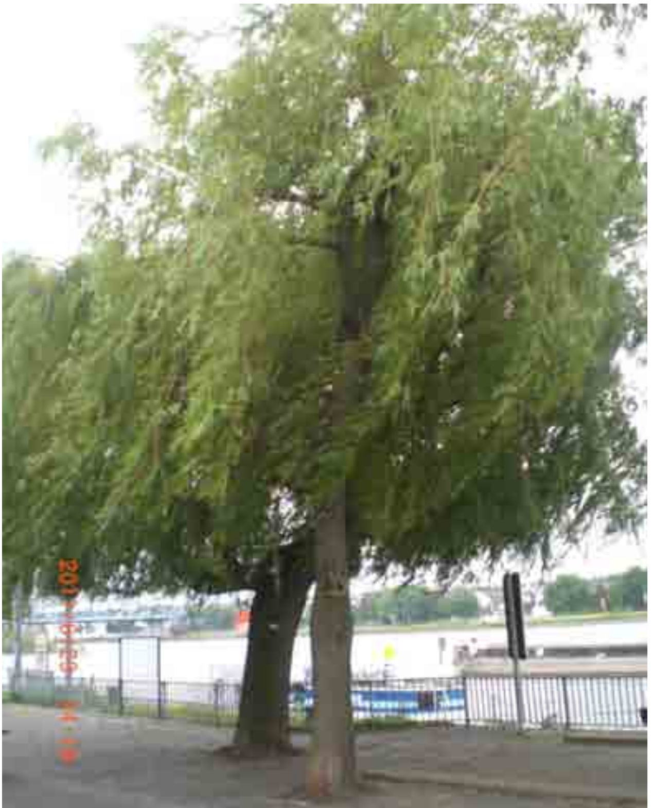
Abb. 28: Gesamtansicht der Weide Nr. 12557