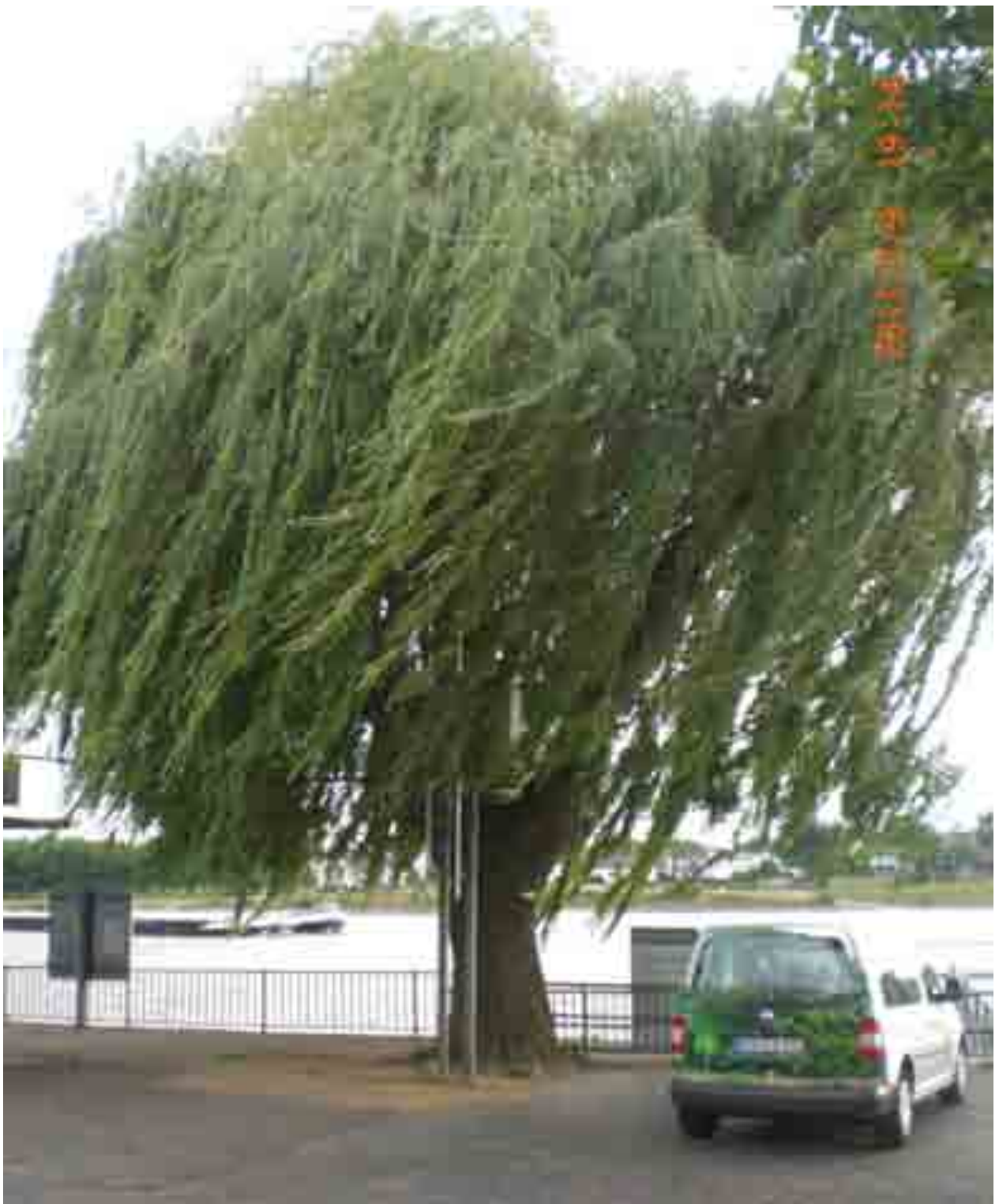
Abb.5: Gesamtansicht der Weide Nr. 12547