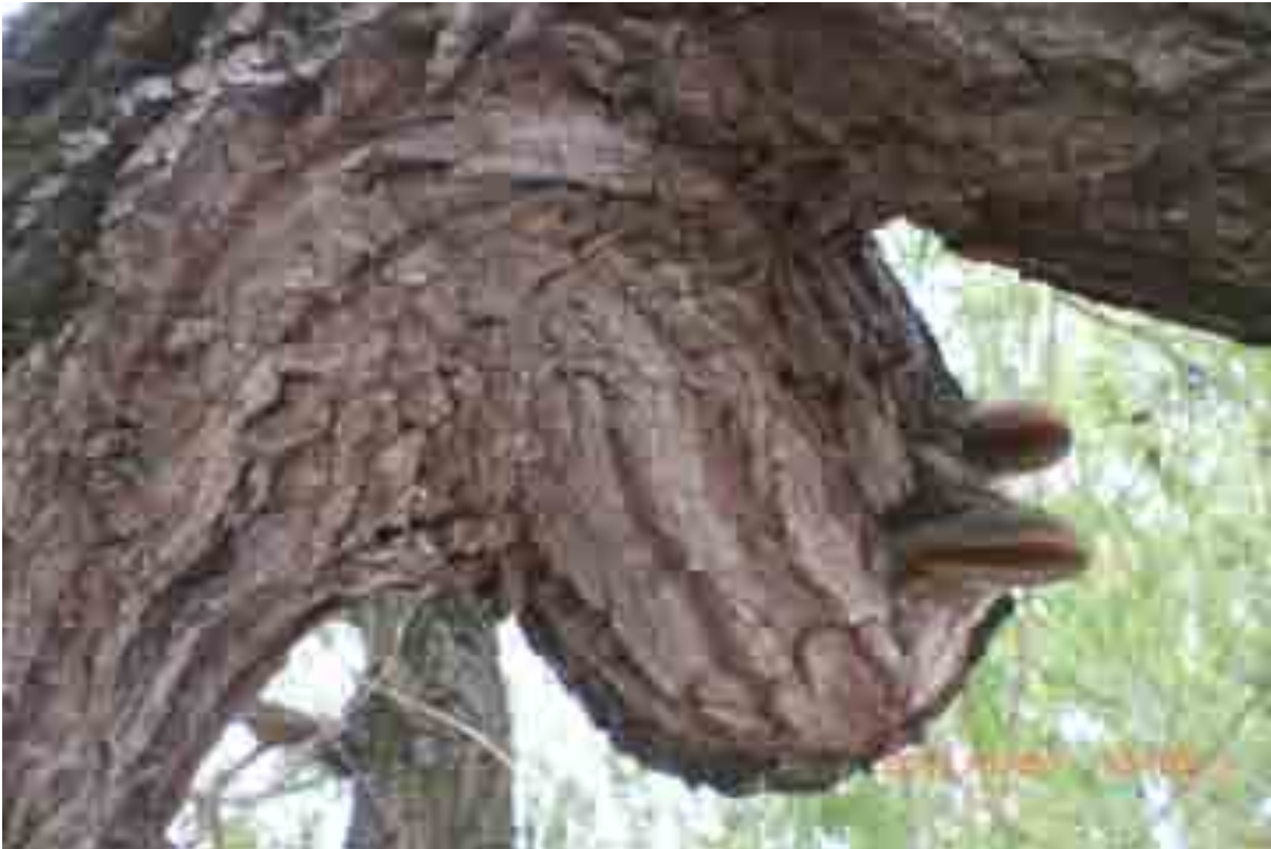
Abb.24: Pilzbefall an Weide Nr. 12555