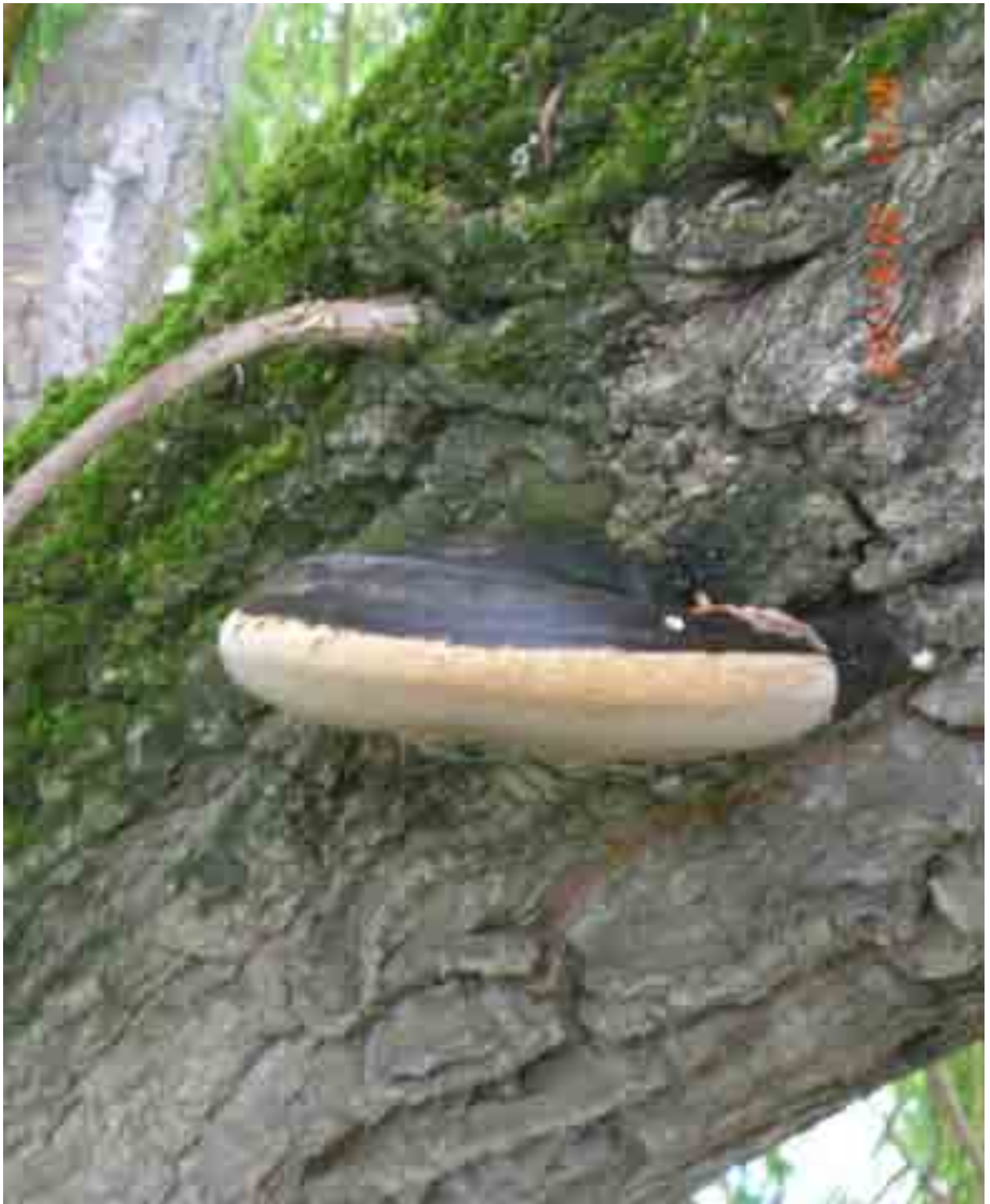
Abb. 33: Feuerschwamm in Weide Nr. 12559