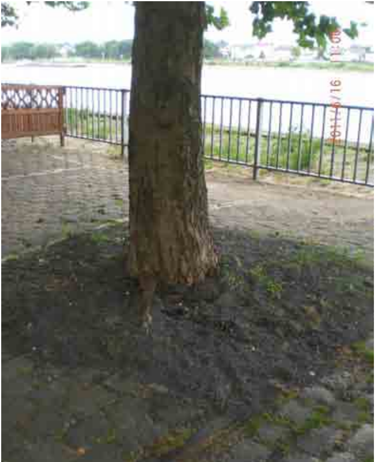
Abb.4: Baumscheibe von Baumnr. 12536