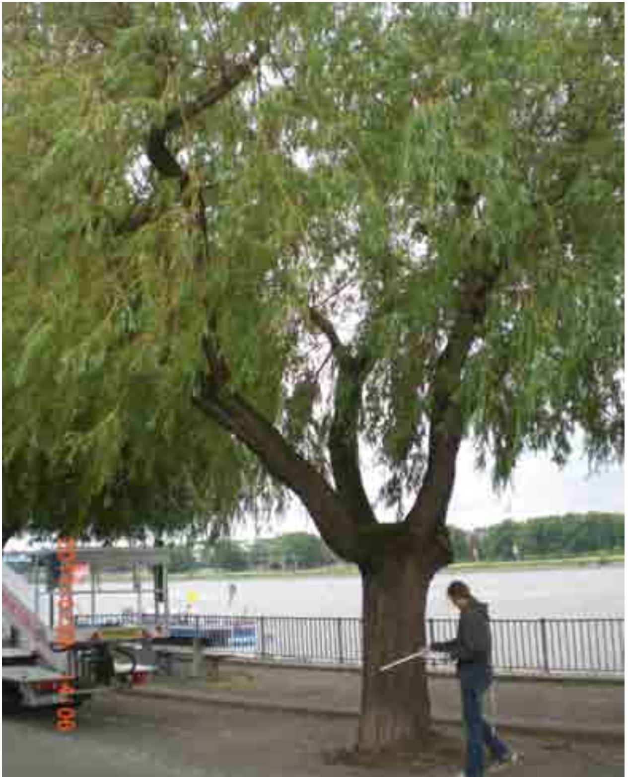
Abb. 26: Gesamtansicht der Weide Nr. 12556