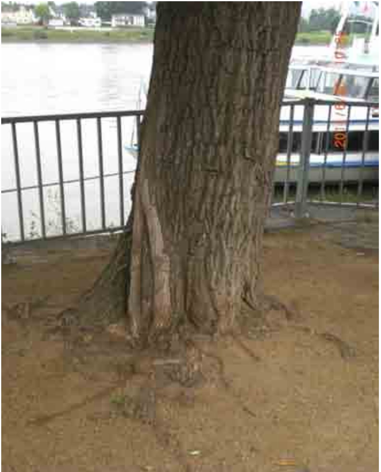
Abb.46: Stammfuß mit Splintholzwunden an Weide Nr. 12568