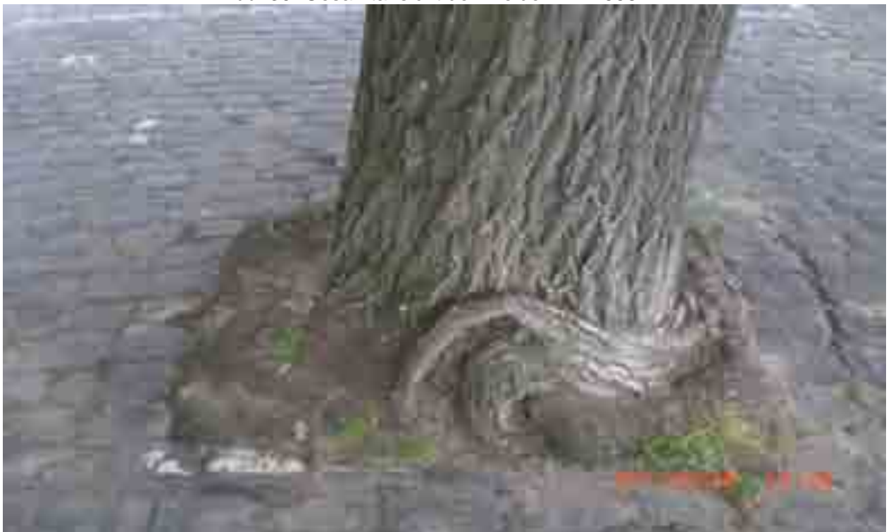
Abb.31: Stammfuß der Weide Nr. 12558