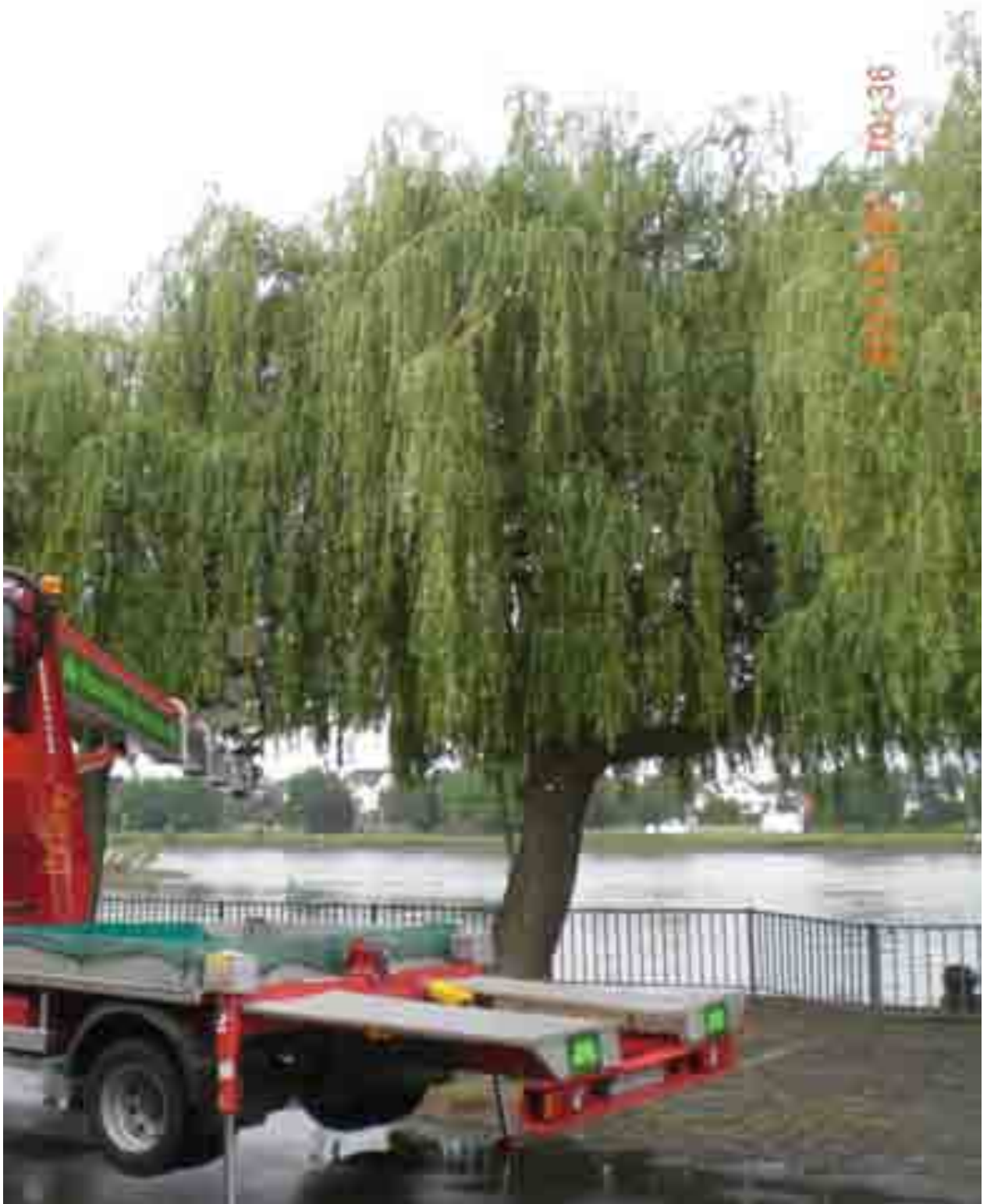
Abb.45: Gesamtansicht der Trauerweide Nr. 12568