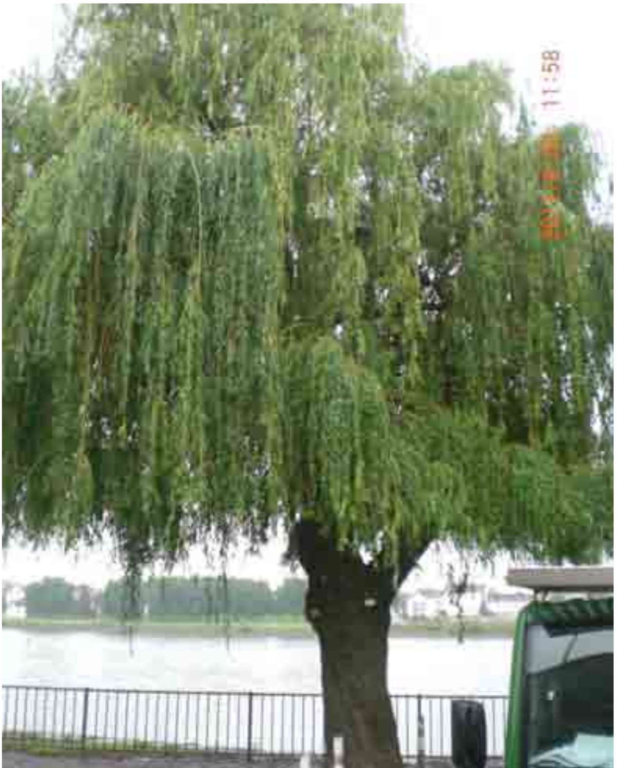
Abb.37: Gesamtansicht der Weide Nr. 12561