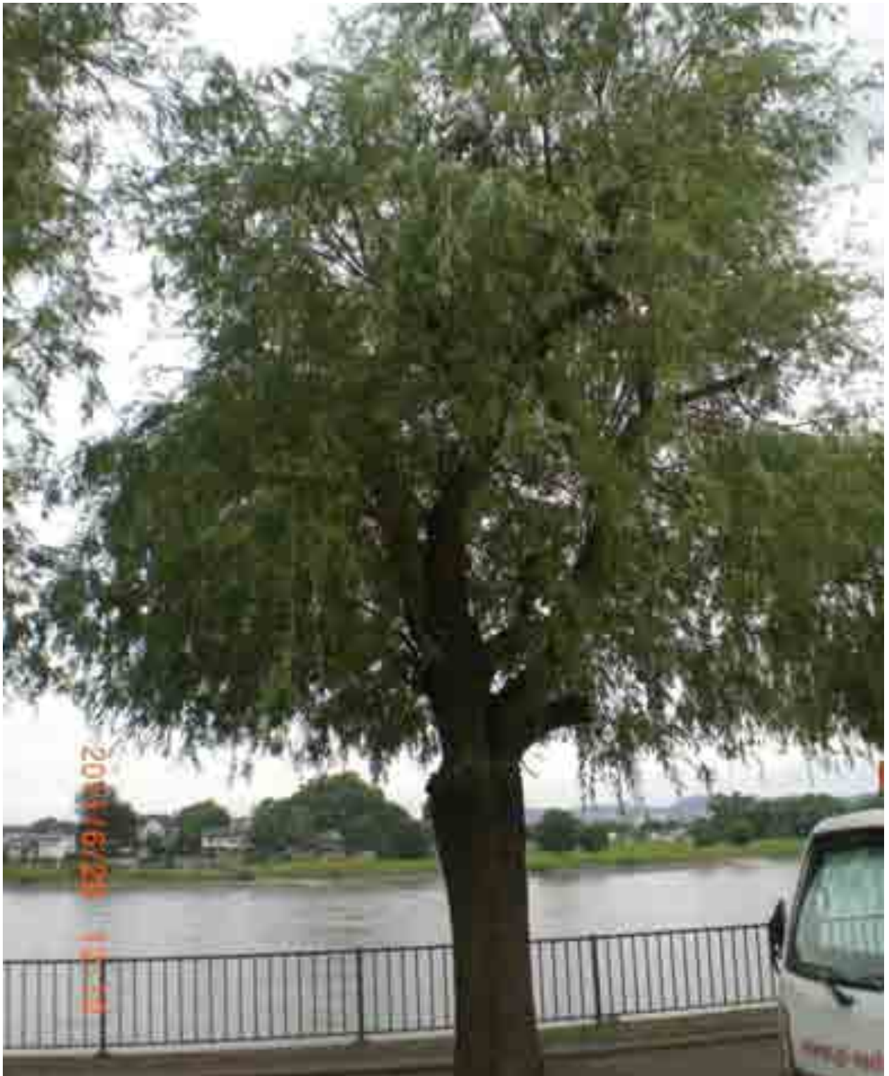
Abb.22: Gesamtansicht der Weide Nr. 12554