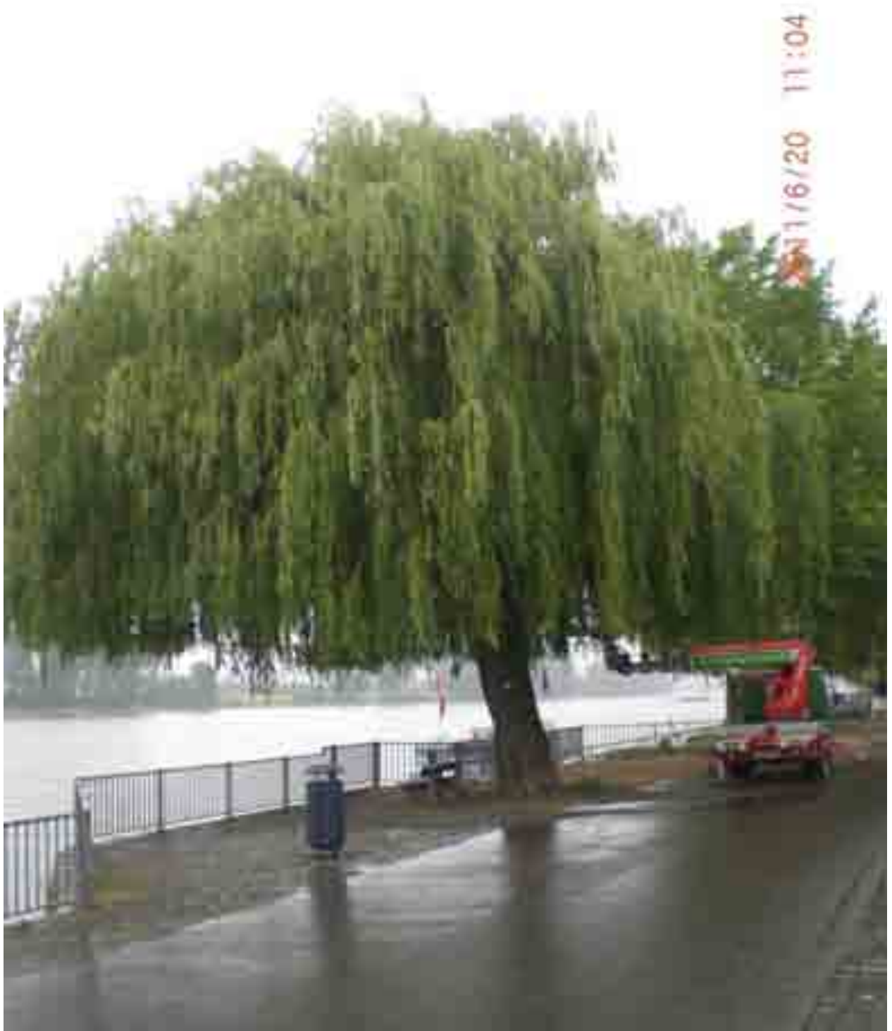
Abb.40: Gesamtansicht der Weide Nr. 12565