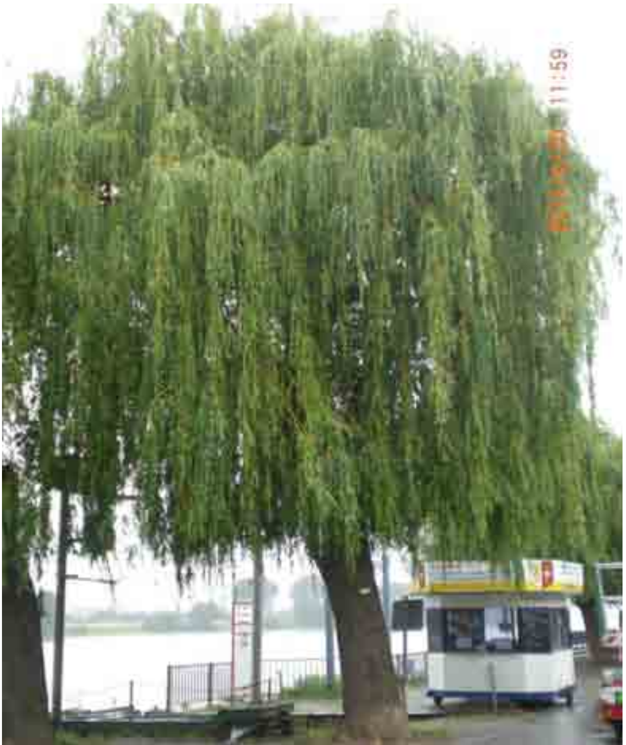
Abb. 32: Gesamtansicht der Trauerweide Nr. 12559