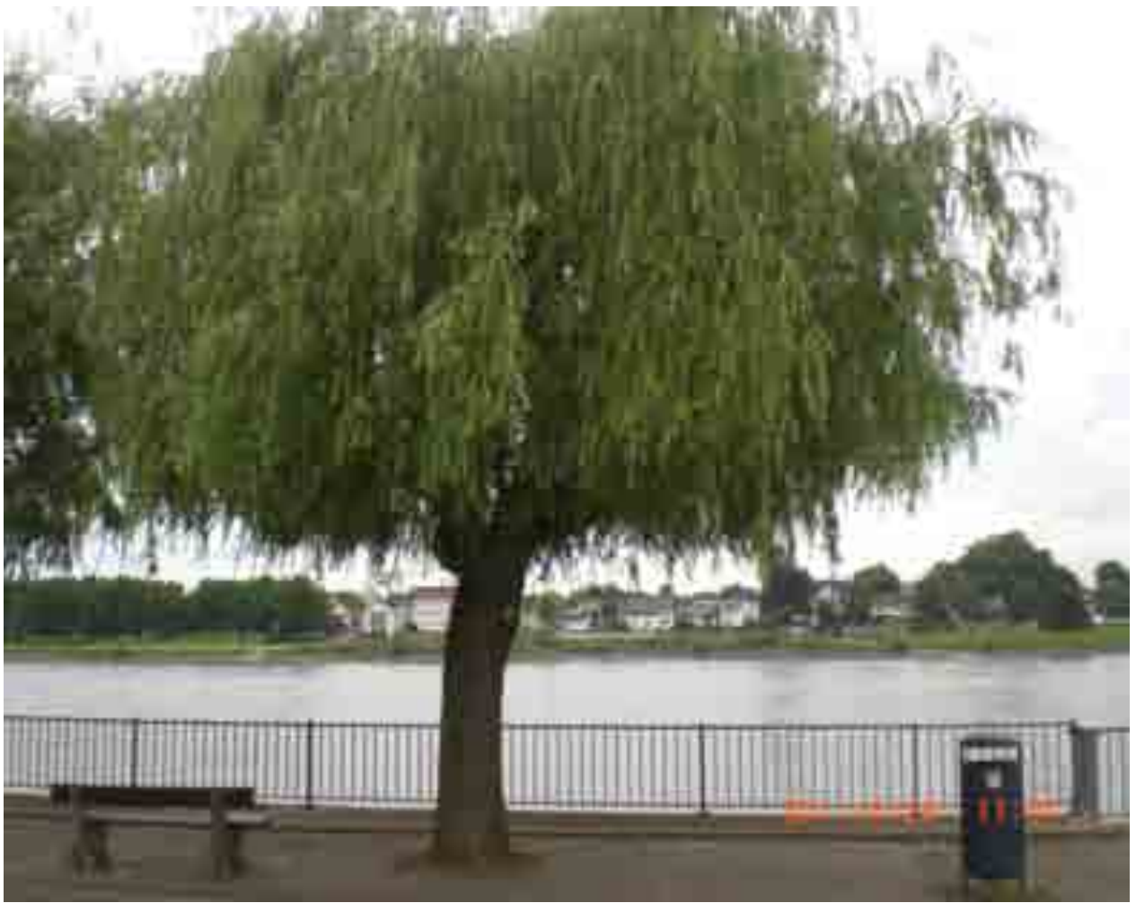
Abb.20: Gesamtansicht der Trauerweide Nr. 12553