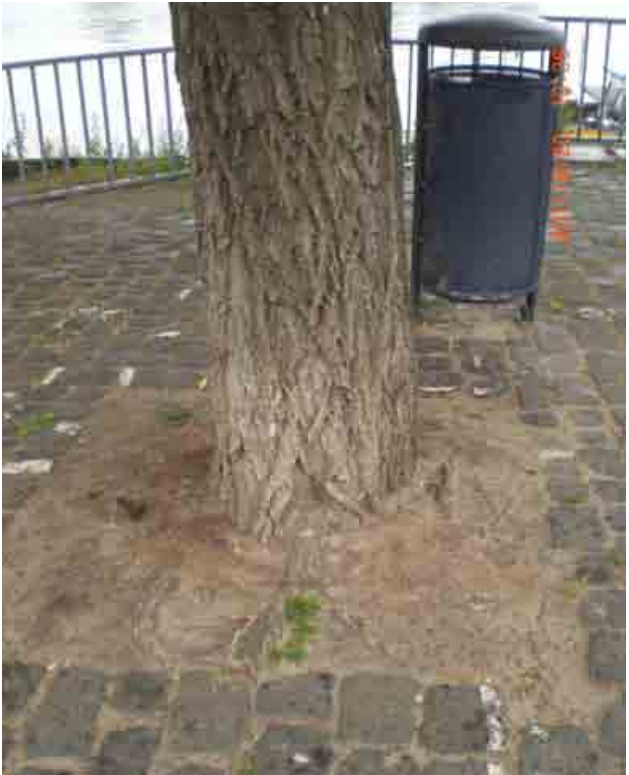
Abb.44: Stammfuß der Weide Nr. 12566