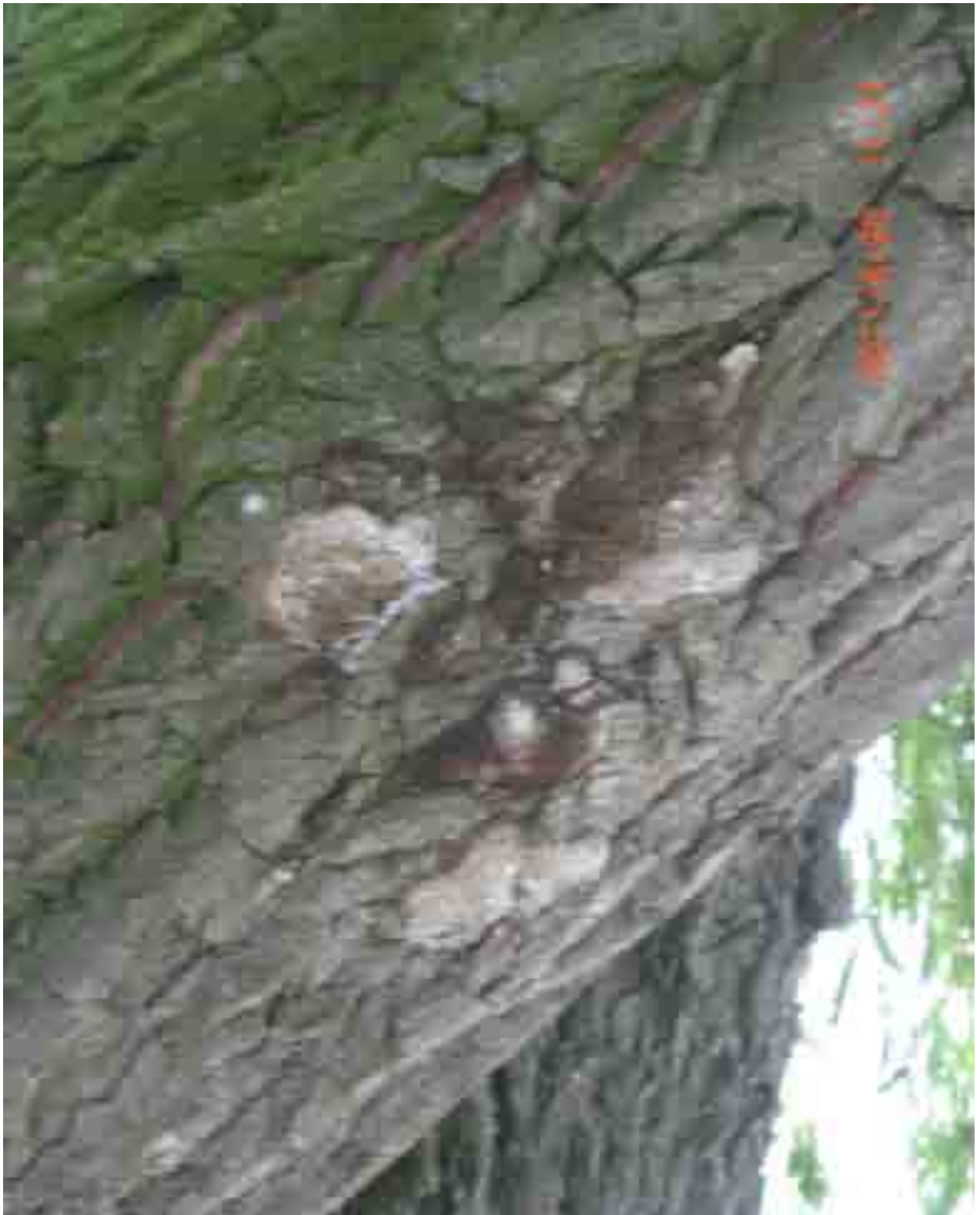
Abb.42: Pilzfruchtkörper an Stämmeling, Nr. 12565