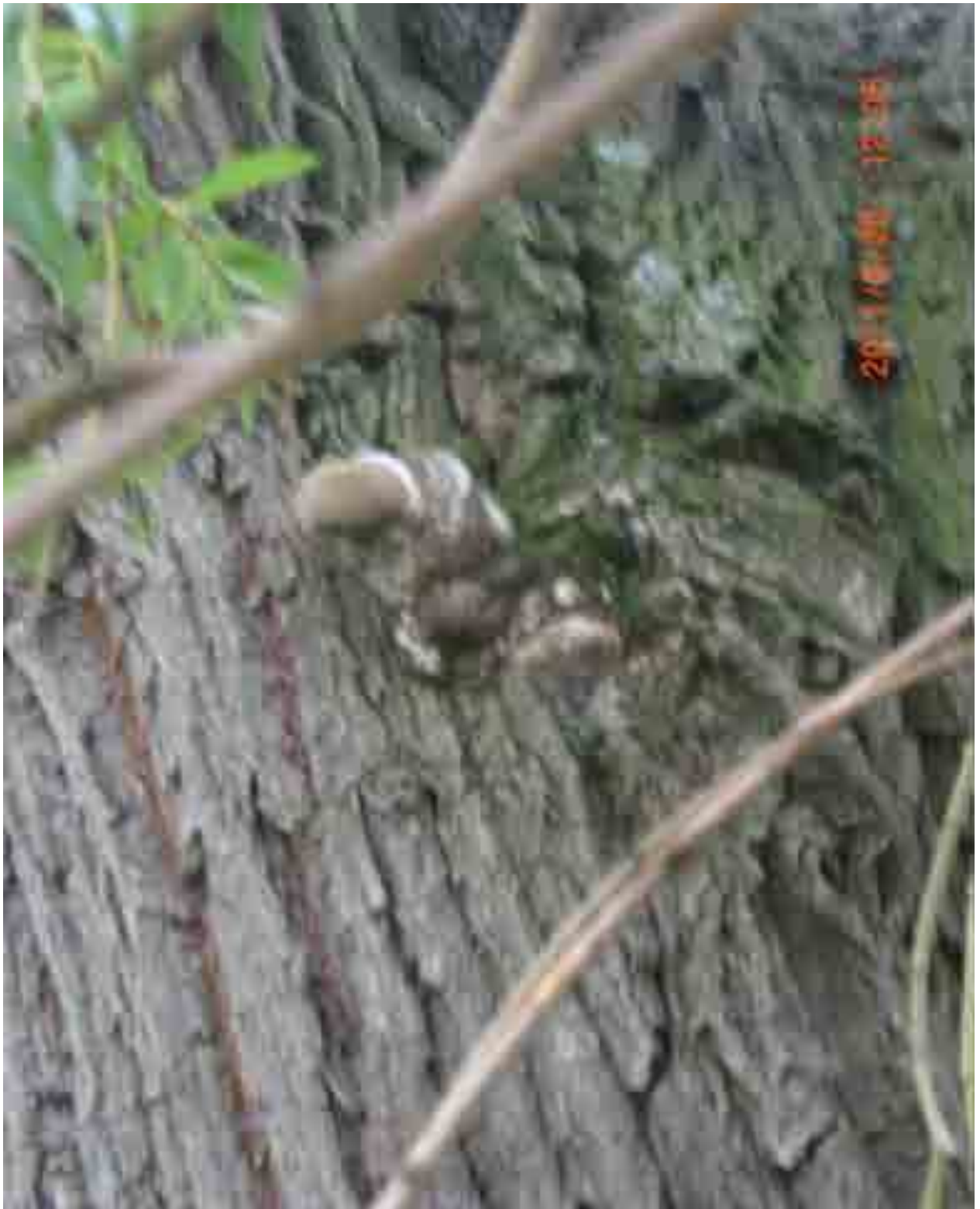
Abb.34: Pilzfruchtkörper Hauptstämmling Weide Nr. 12559