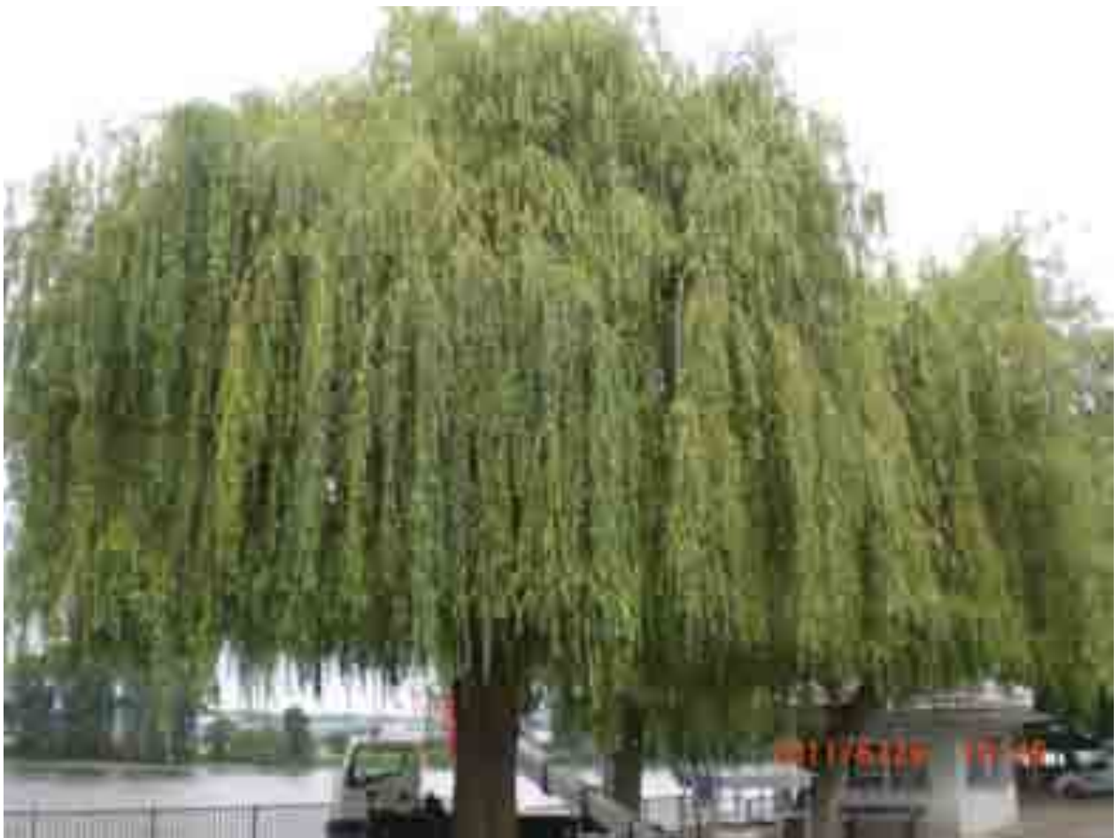
Abb.14: Gesamtansicht der Weide Nr. 12550