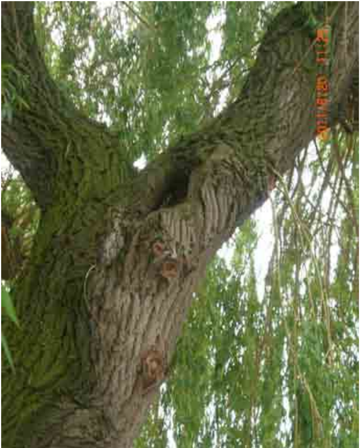
Abb.41: Offene tiefreichende Faulstelle an Stämmeling, Nr. 12565