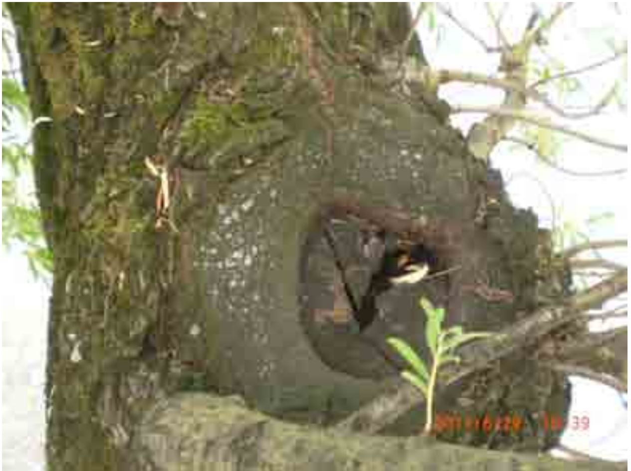
Abb. 13: Eingefaulte Astungswunde Weide Nr. 12549