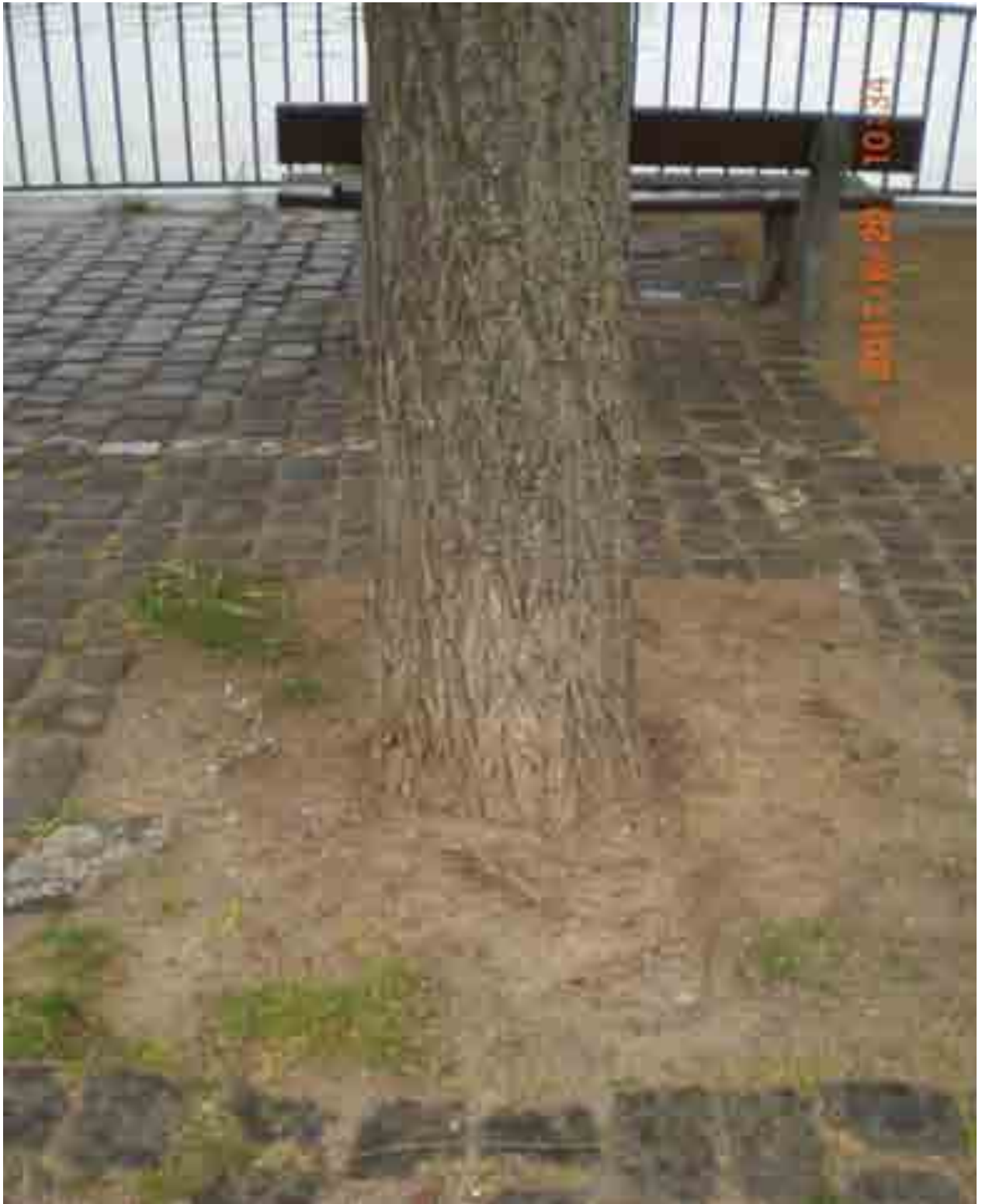
Abb.49: Stammfuß der Weide Nr. 12569