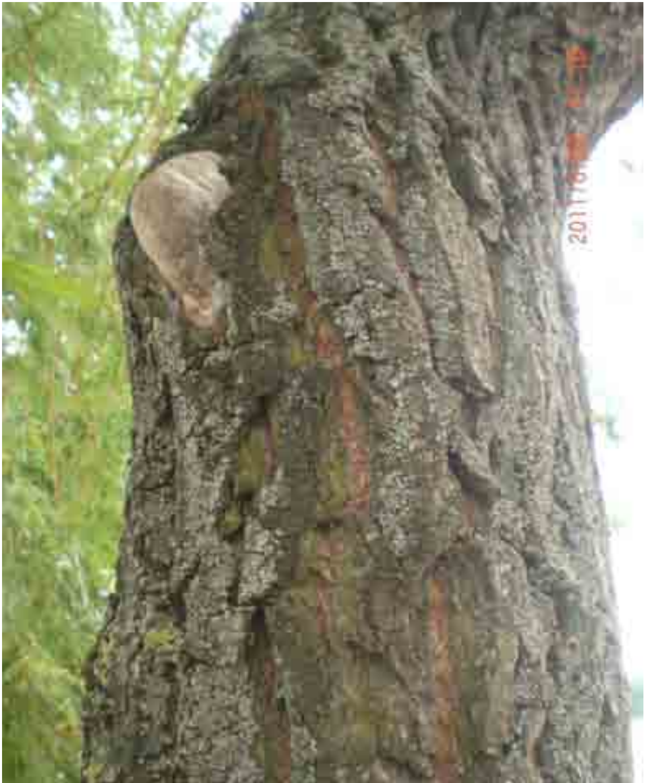
Abb.17: Pilzbefall an Weide Nr. 12551