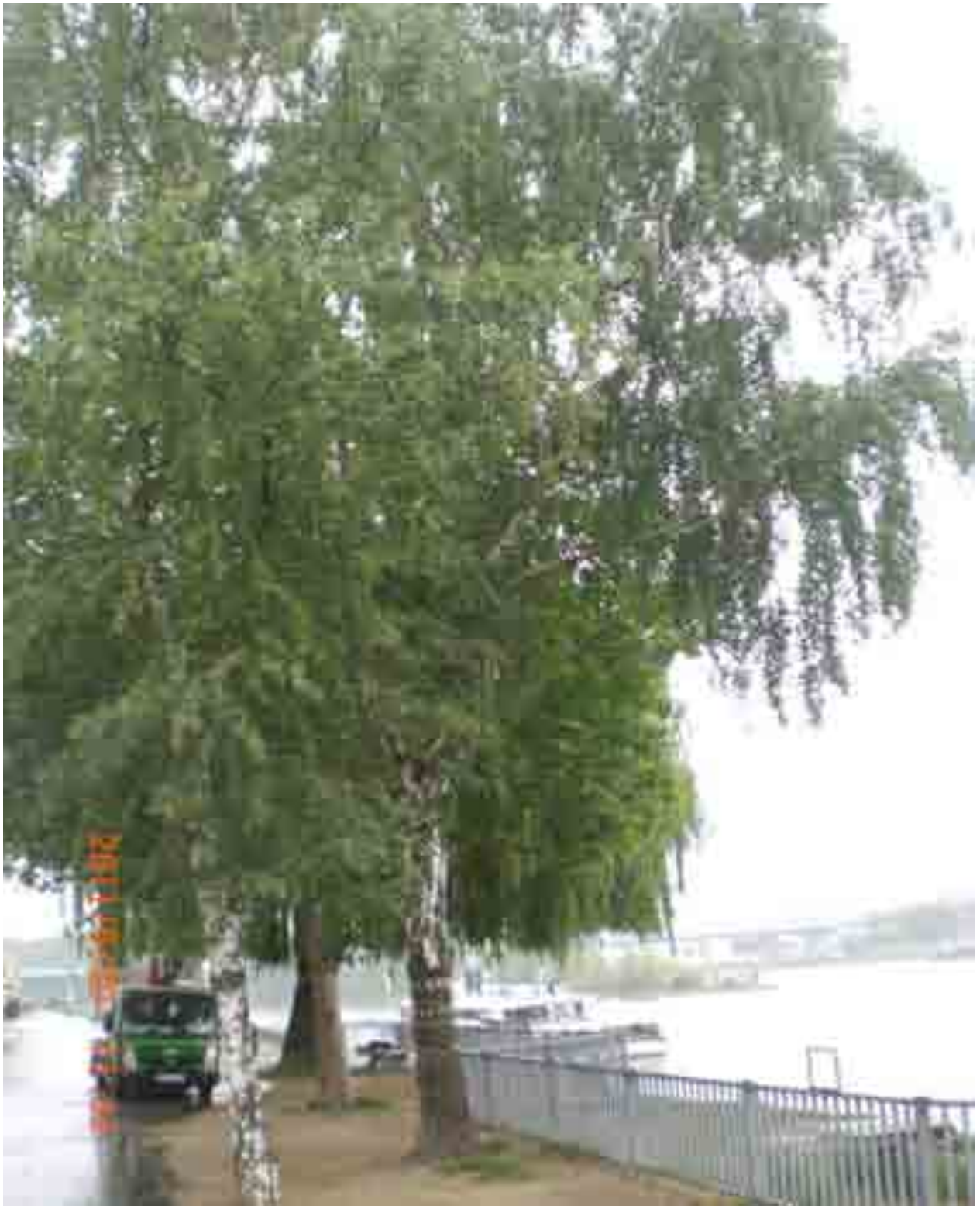
Abb.39: Gesamtansicht der Bäume Nr. 12562, 12563 und 12564