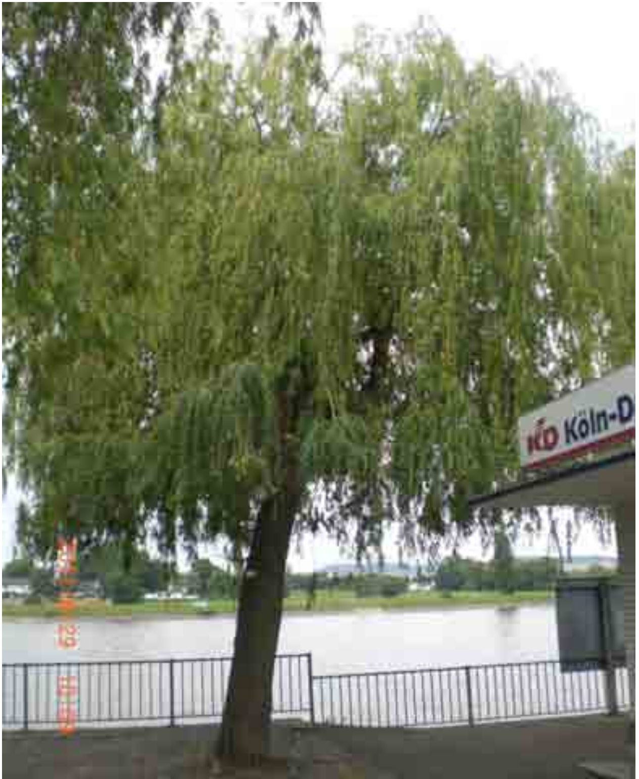
Abb. 8: Gesamtansicht der Weide Nr. 12548