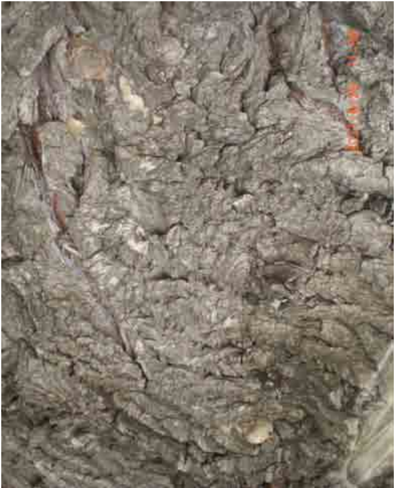
Abb.21: Pilzbefall an Weide Nr. 12553