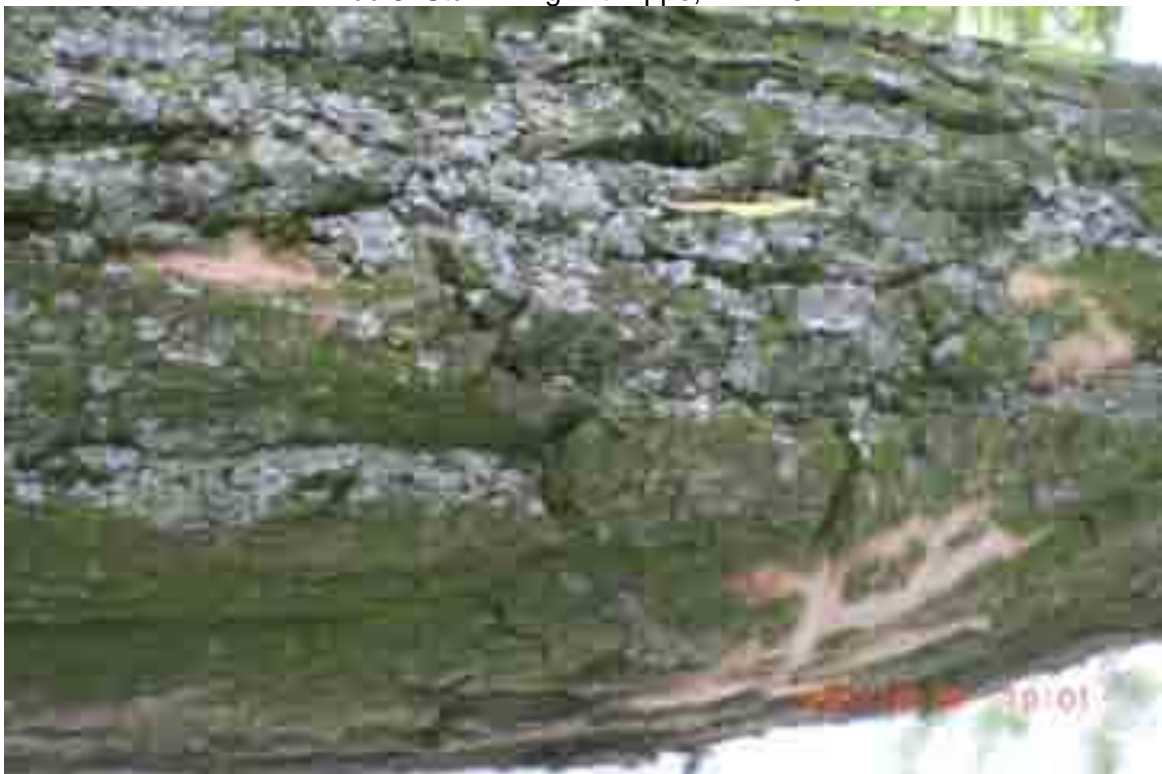
Abb. 7: Stämmling mit Pilzbefall, Nr. 12547