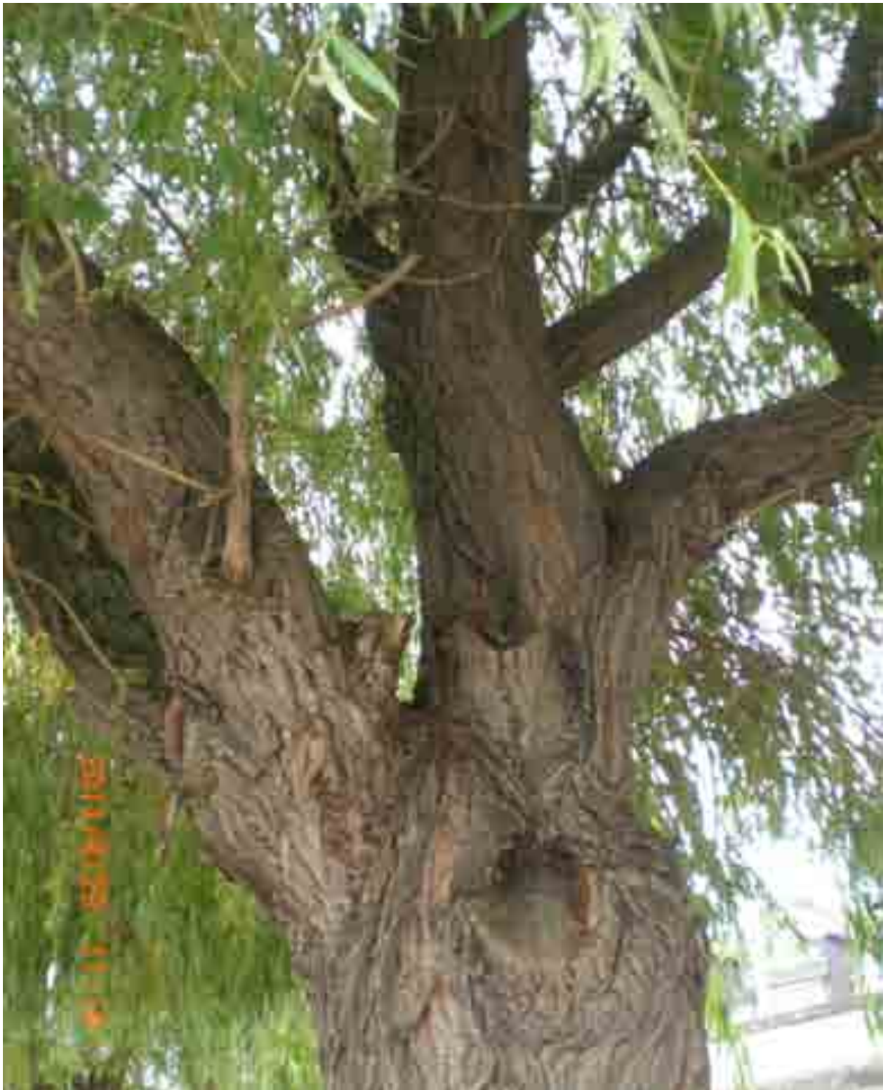
Abb.19: Kronenansatz der Weide Nr. 12552