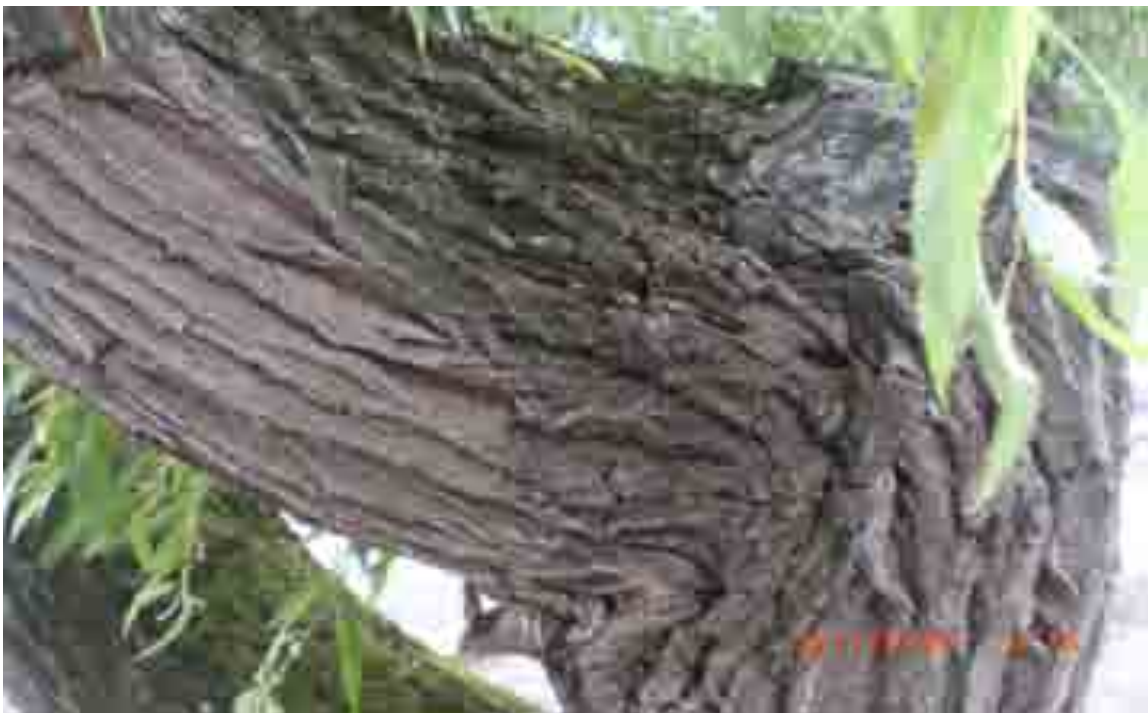
Abb.25: Unglückbalken an Weide Nr. 12555