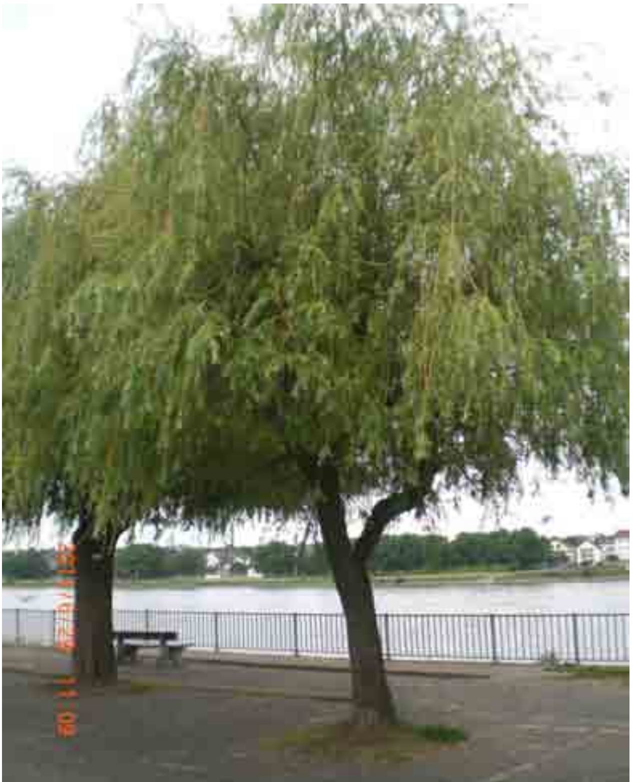
Abb.16: Gesamtansicht der Weide Nr. 12551