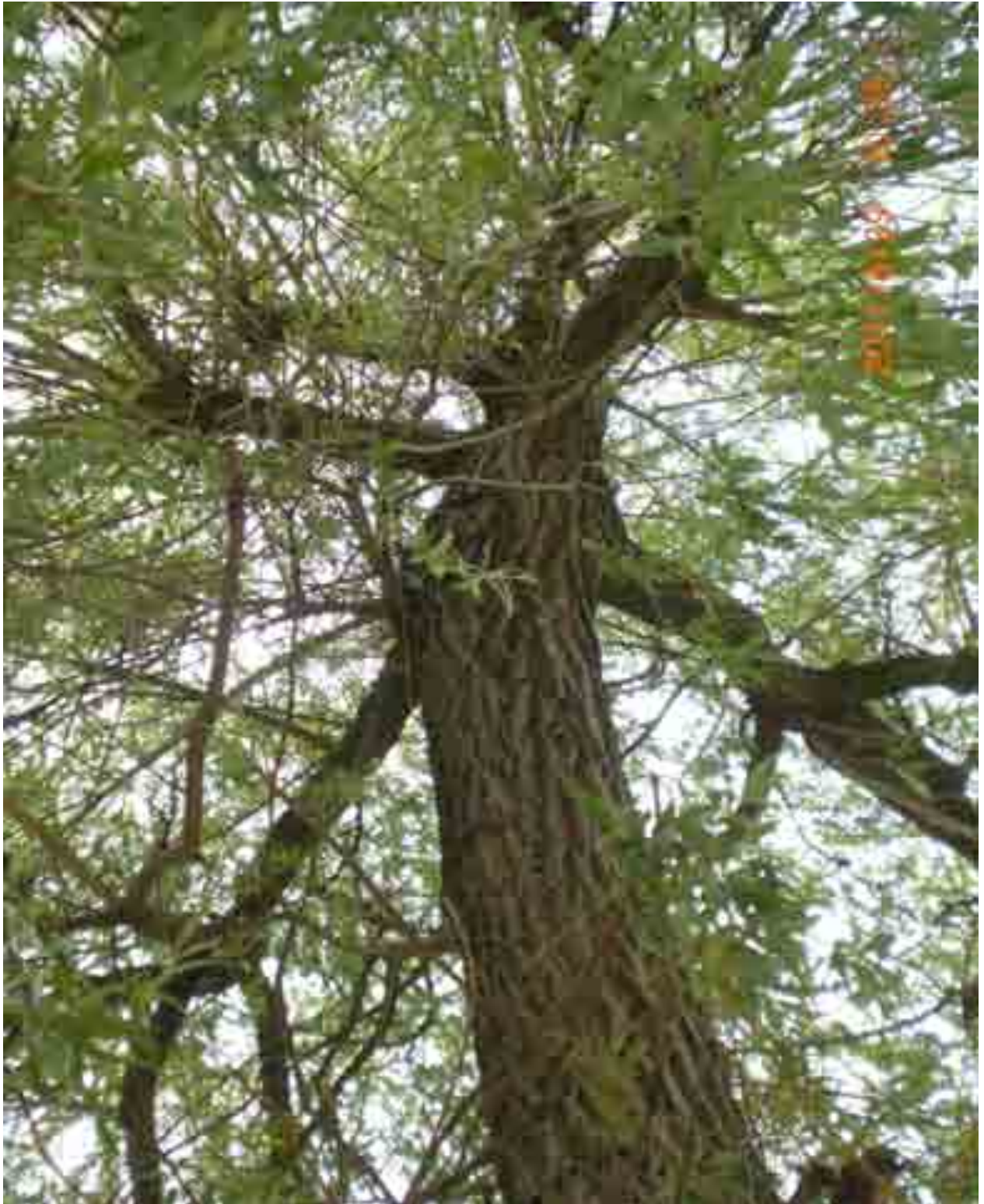
Abb. 12: Blick in den Kronenbereich Nr. 12549