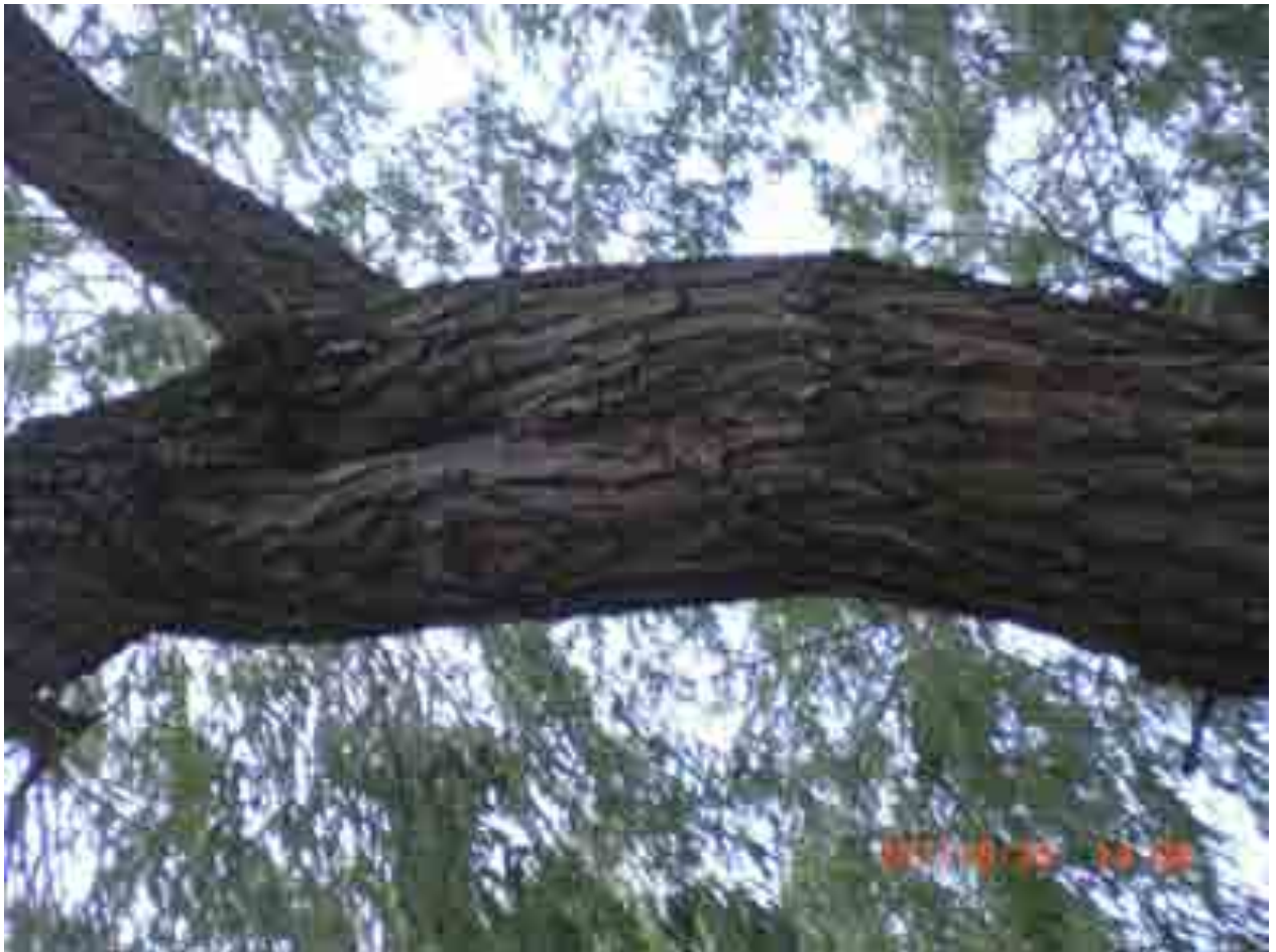
Abb.27: Überwallte Astungswunde