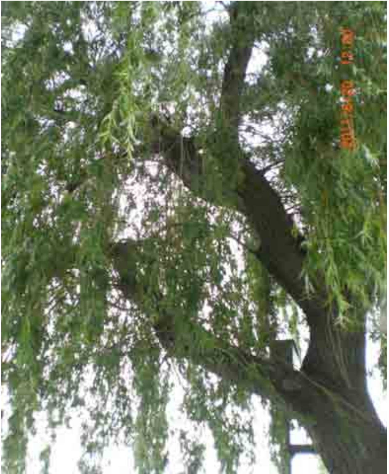
Abb.36: Einseitige Krone der Weide Nr. 12560