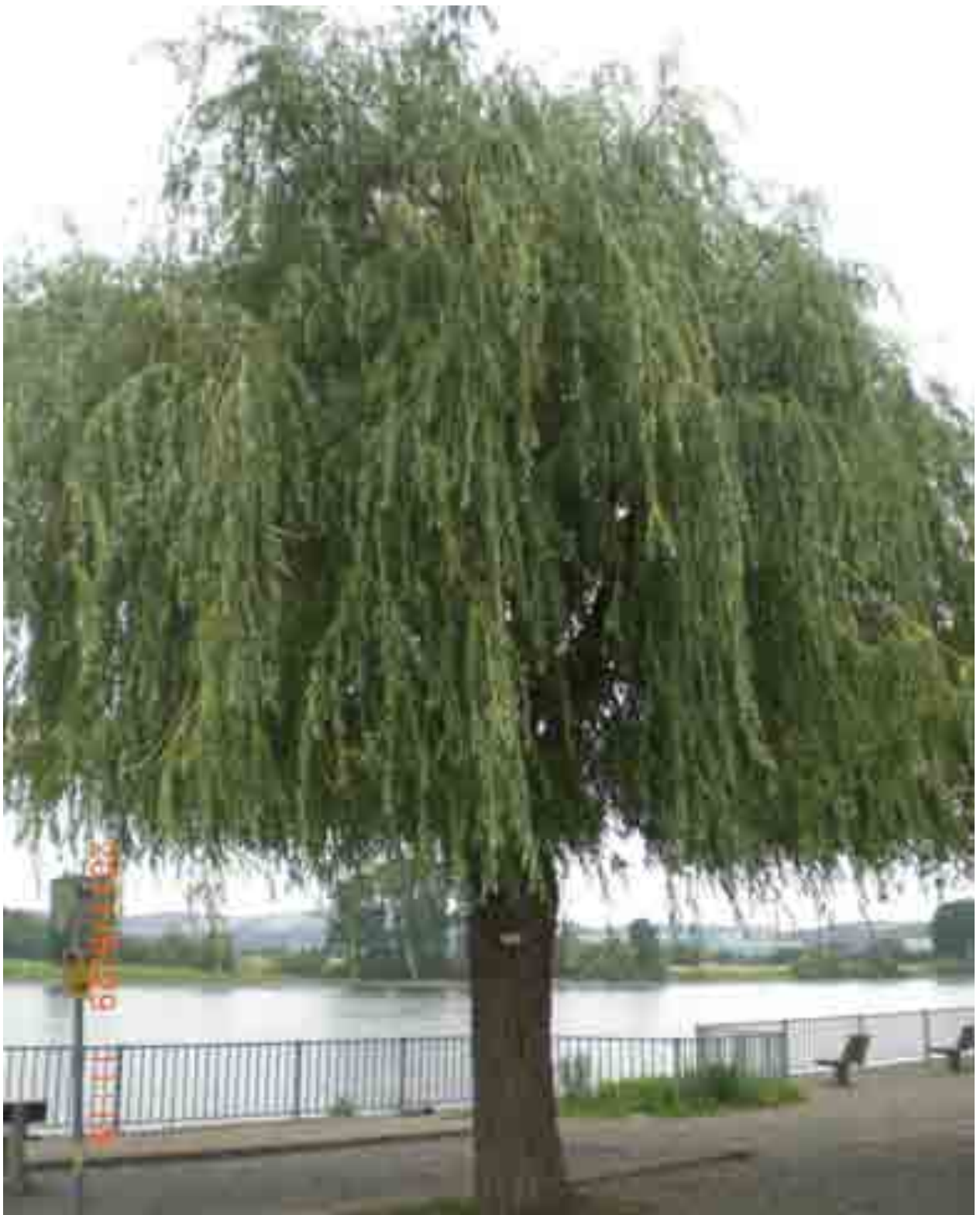
Abb.18: Gesamtansicht der Weide Nr. 12552