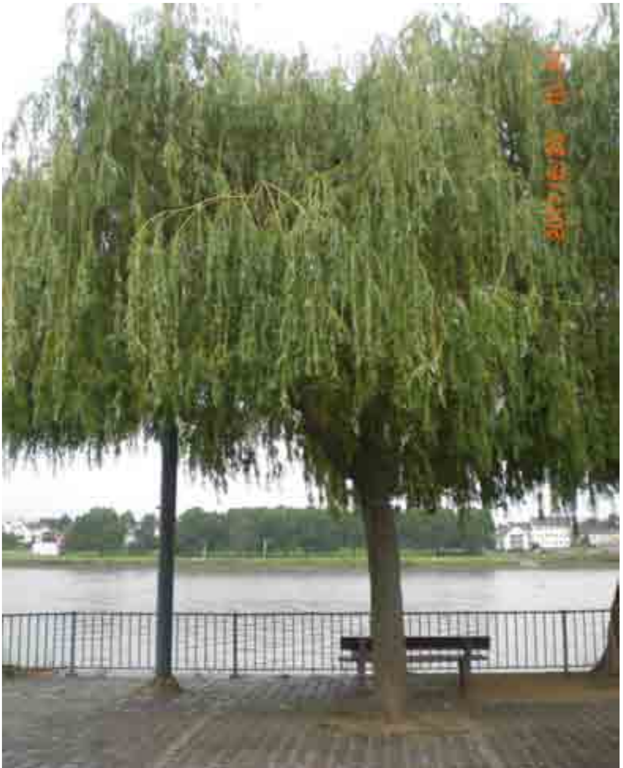
Abb.48: Gesamtansicht der Weide Nr. 12569