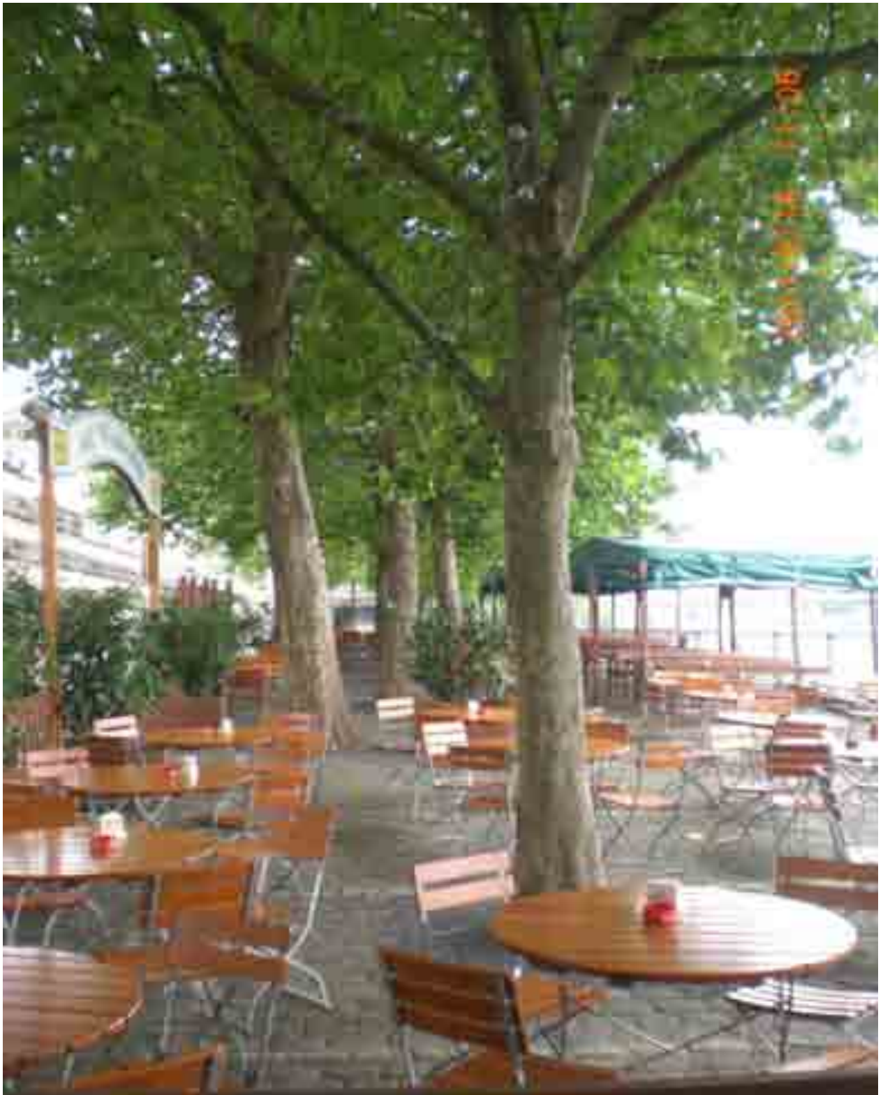
Abb.2: Bestuhlung des Biergartens unter den Platanen