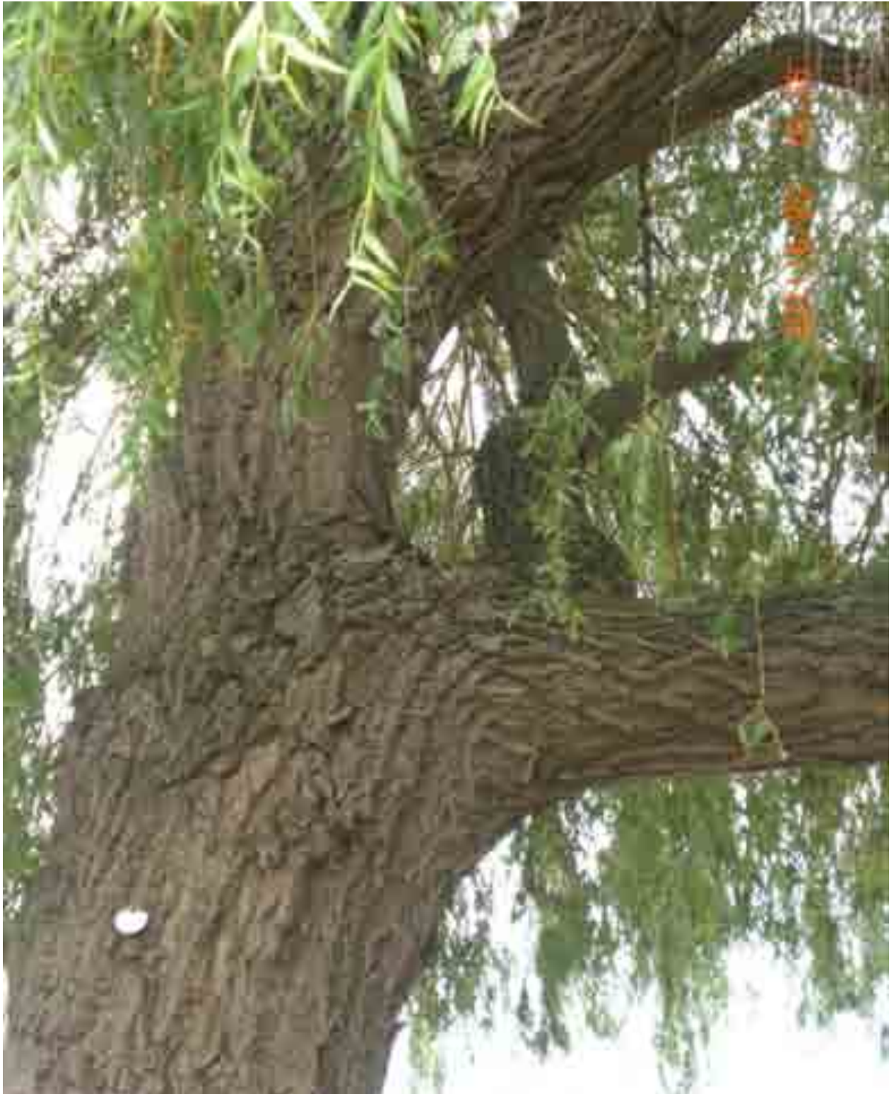
Abb 47: Kronenansatz der Weide Nr. 12568