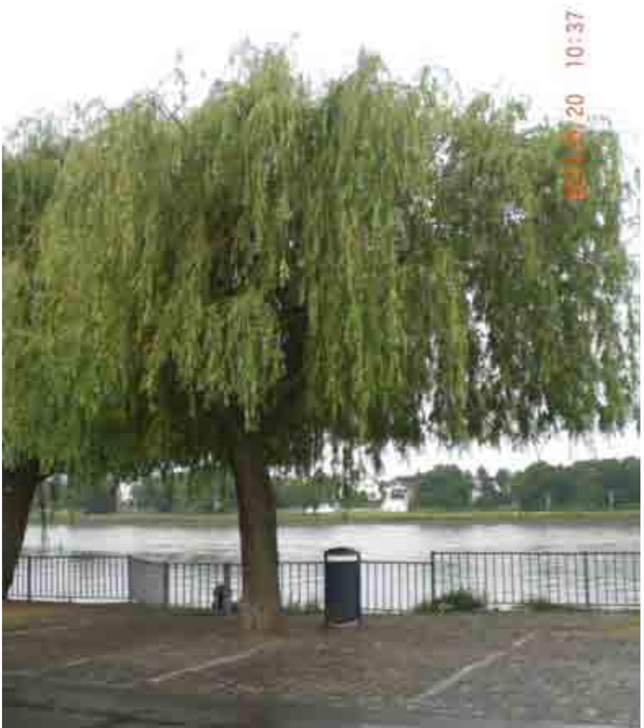
Abb. 43: Gesamtansicht der Weide Nr. 12566