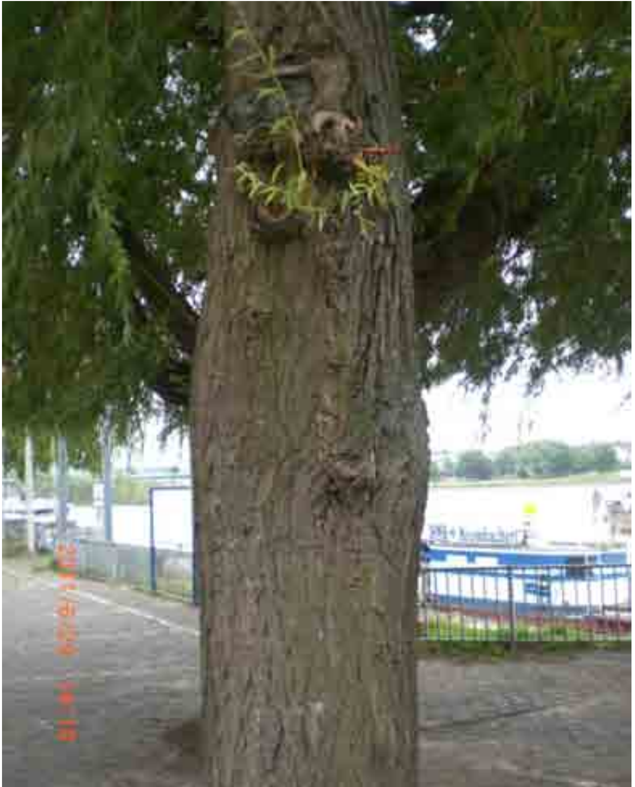
Abb.29: Stammereich mit Beulenbildung, Nr. 12557