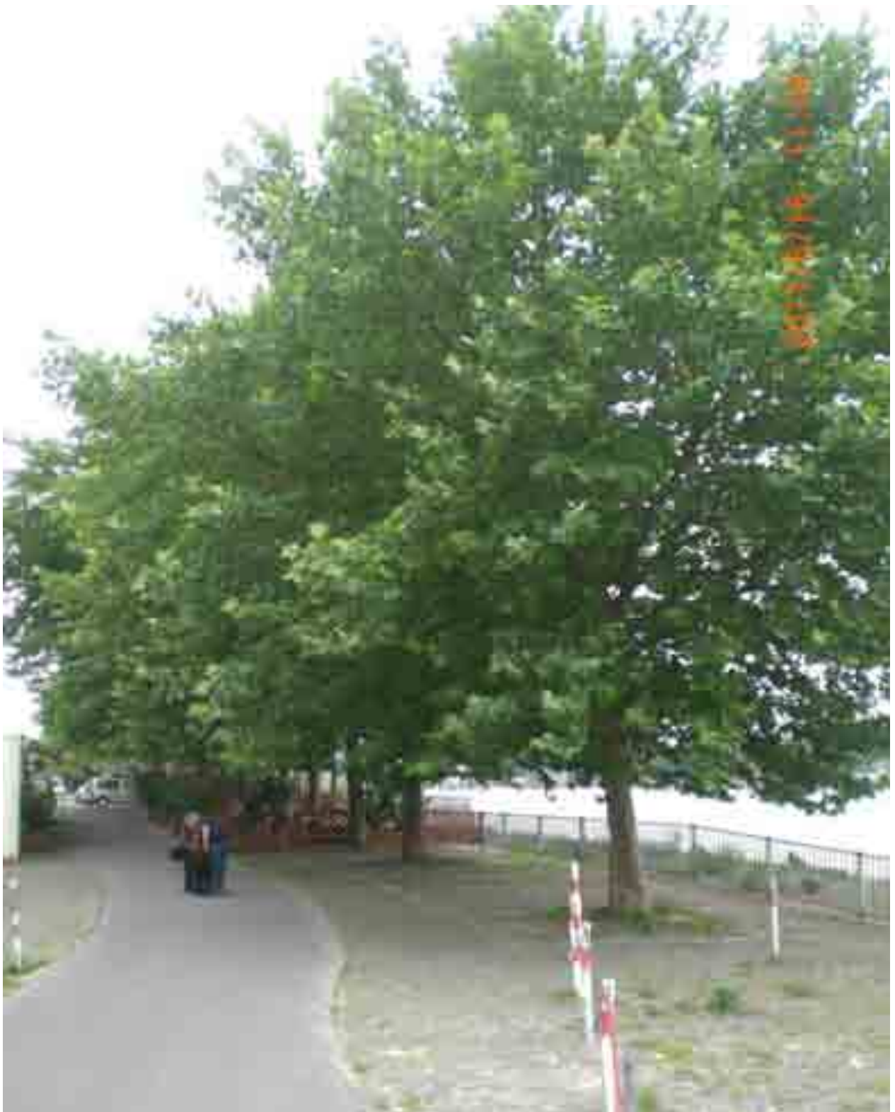
Abb.3: Gesamtansicht der Platanen von Nord/West