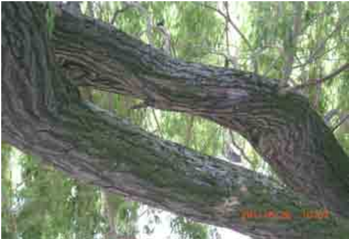
Abb.6: Stämmling mit Rippe, Nr. 12547