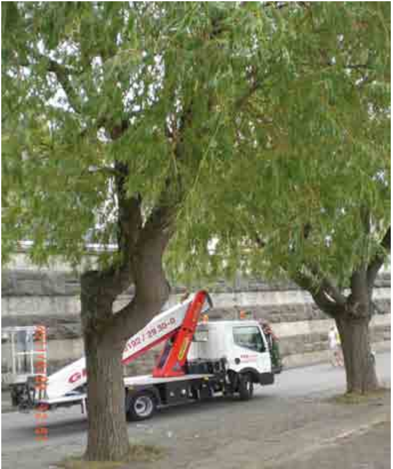
Abb.23: Gesamtansicht der Weide Nr. 12555