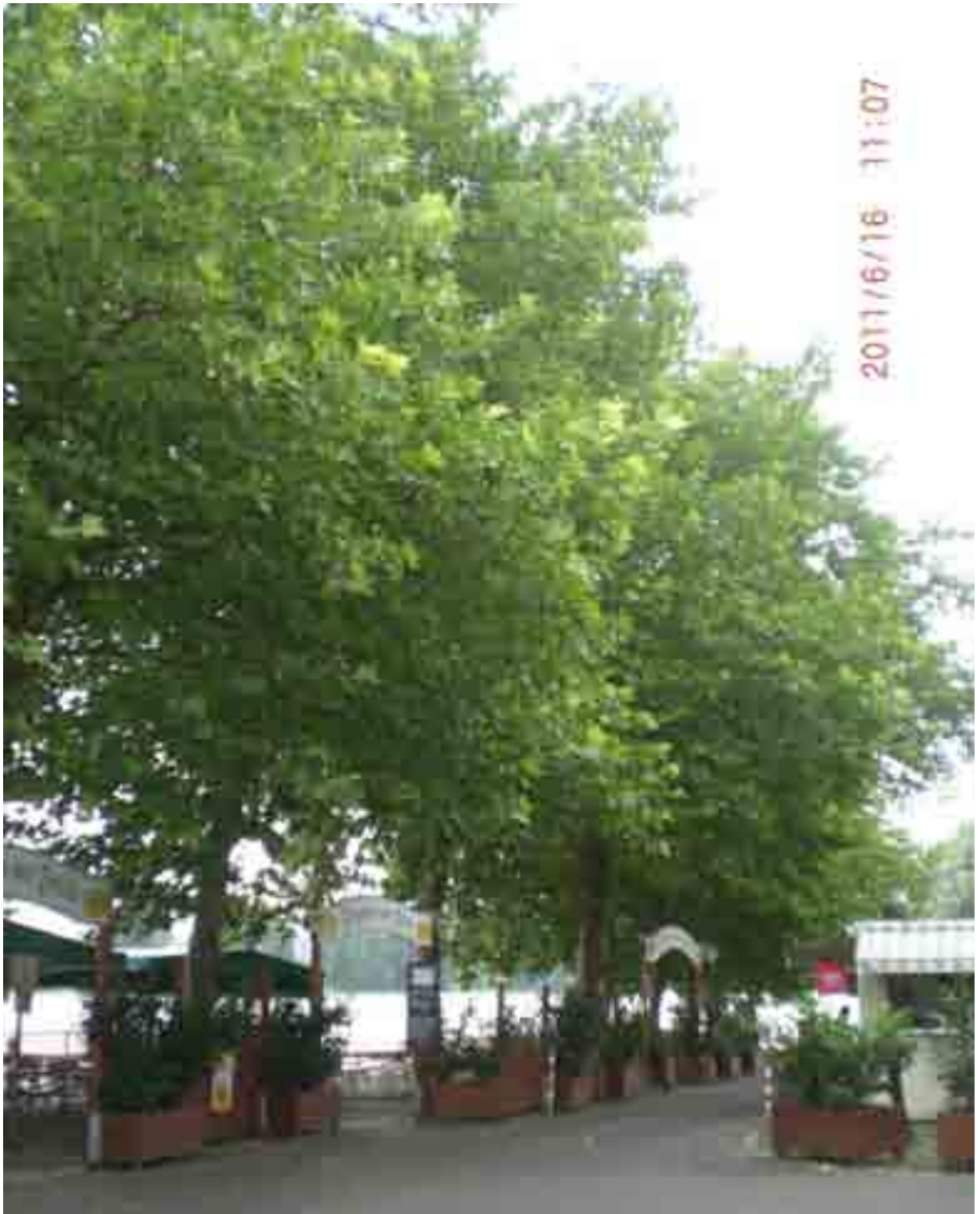
Abb.1: Gesamtansicht der Platanen im Bereich des Biergartens