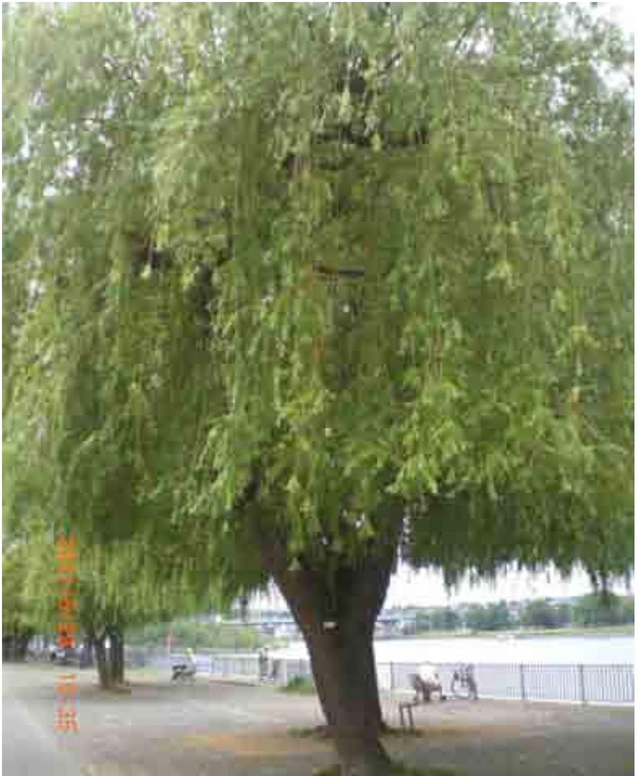
Abb. 11: Gesamtansicht der Weide Nr. 12549