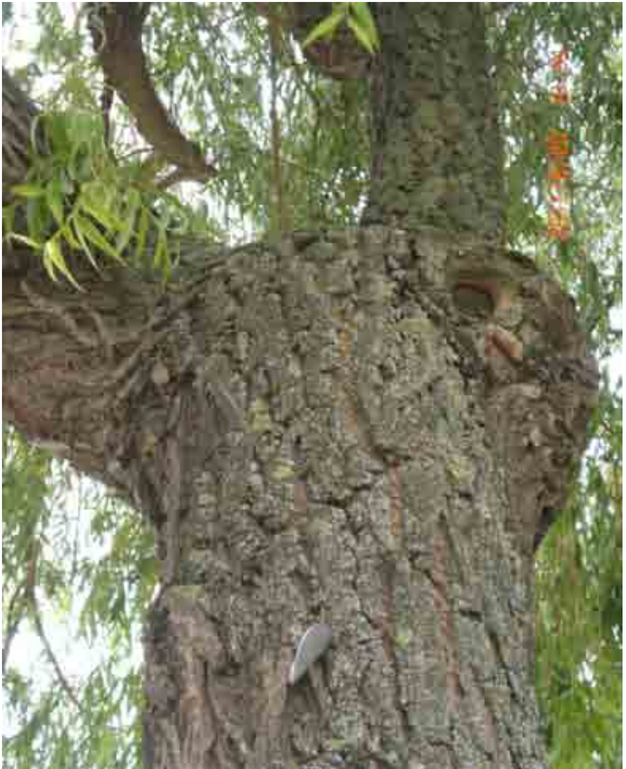
Abb.50: Blick in den Kronenbereich der Weide Nr. 12569