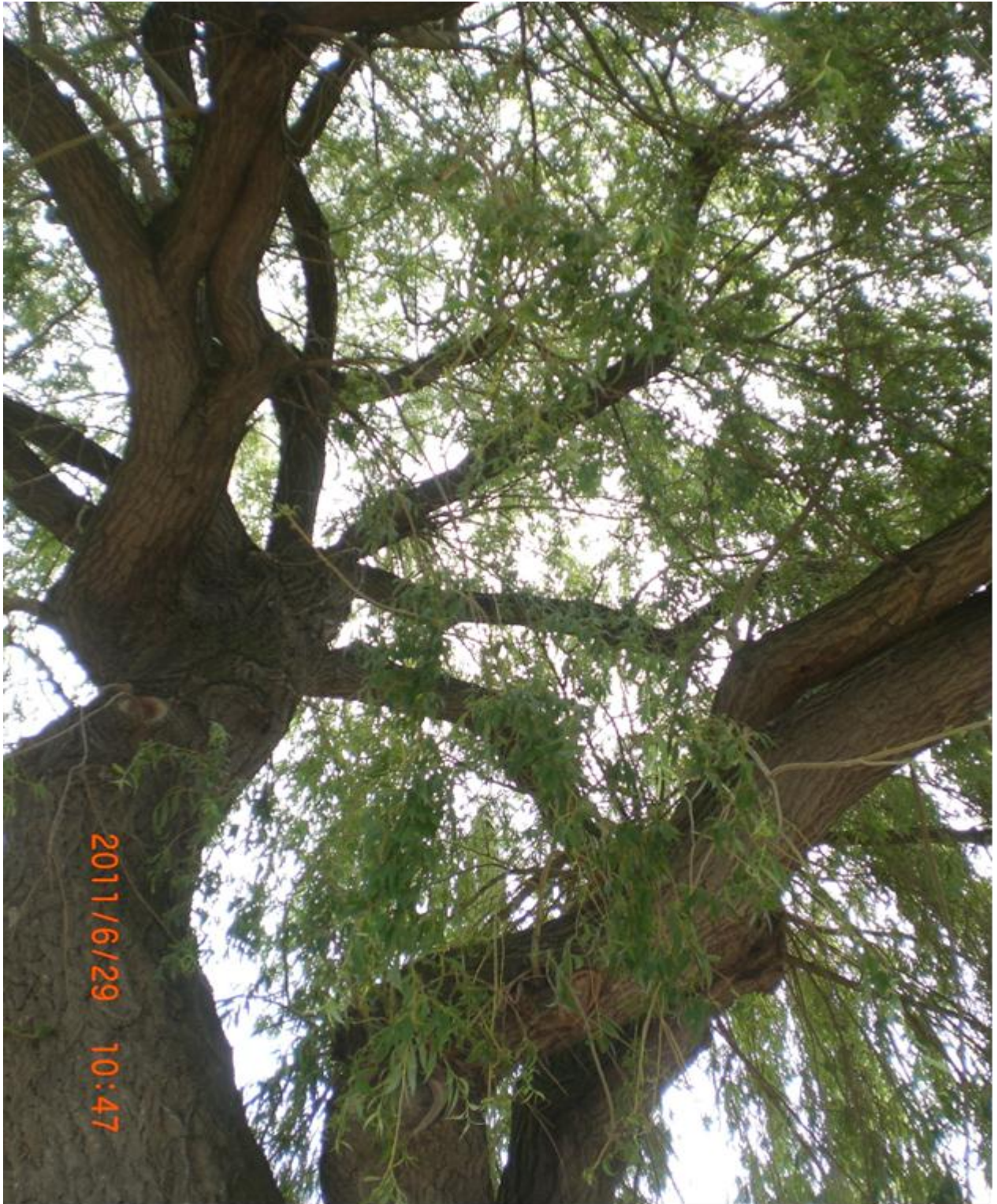
Abb.15: Kronenbereich der Weide Nr. 12550