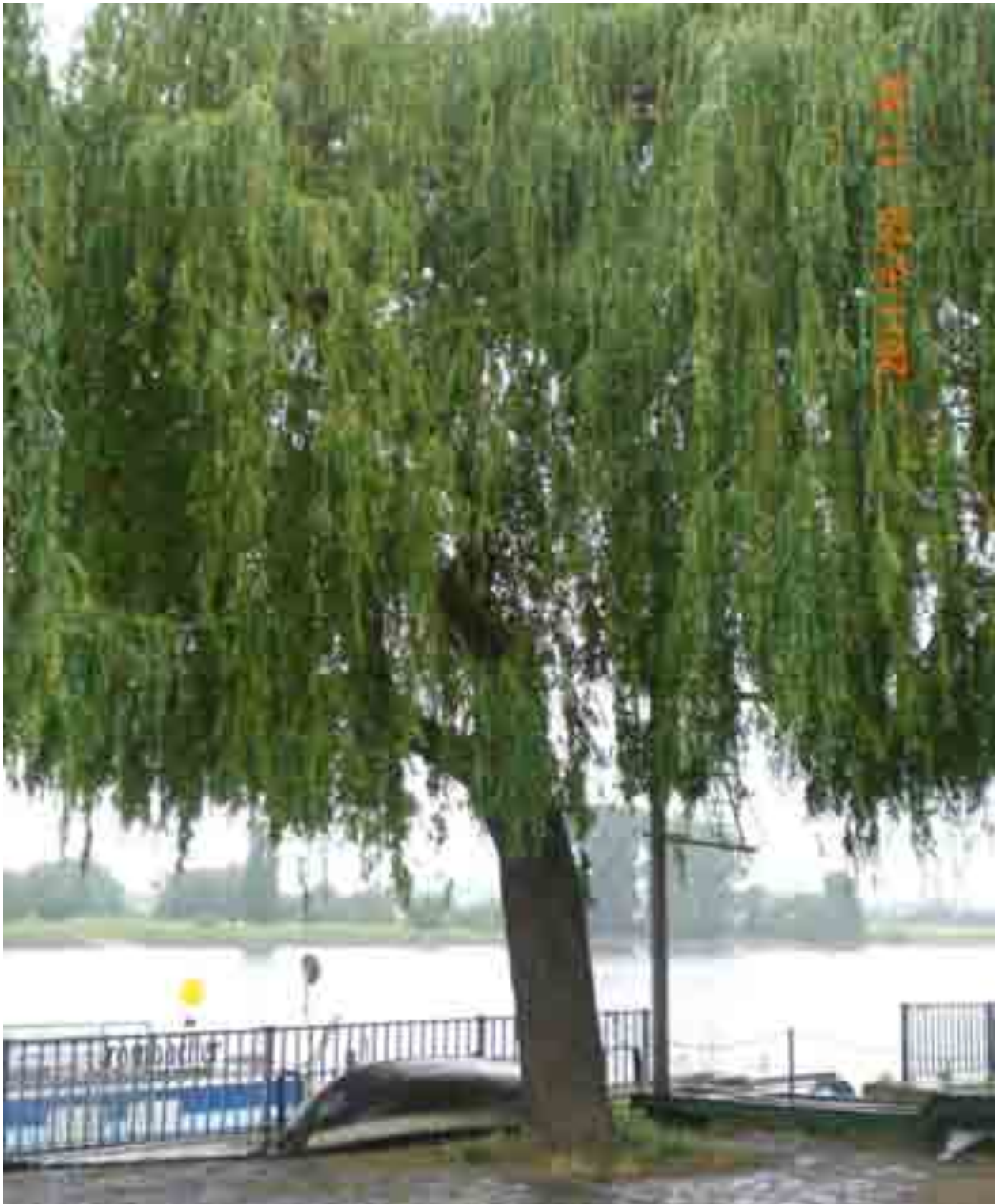
Abb.35: Gesamtansicht der Weide Nr. 12560