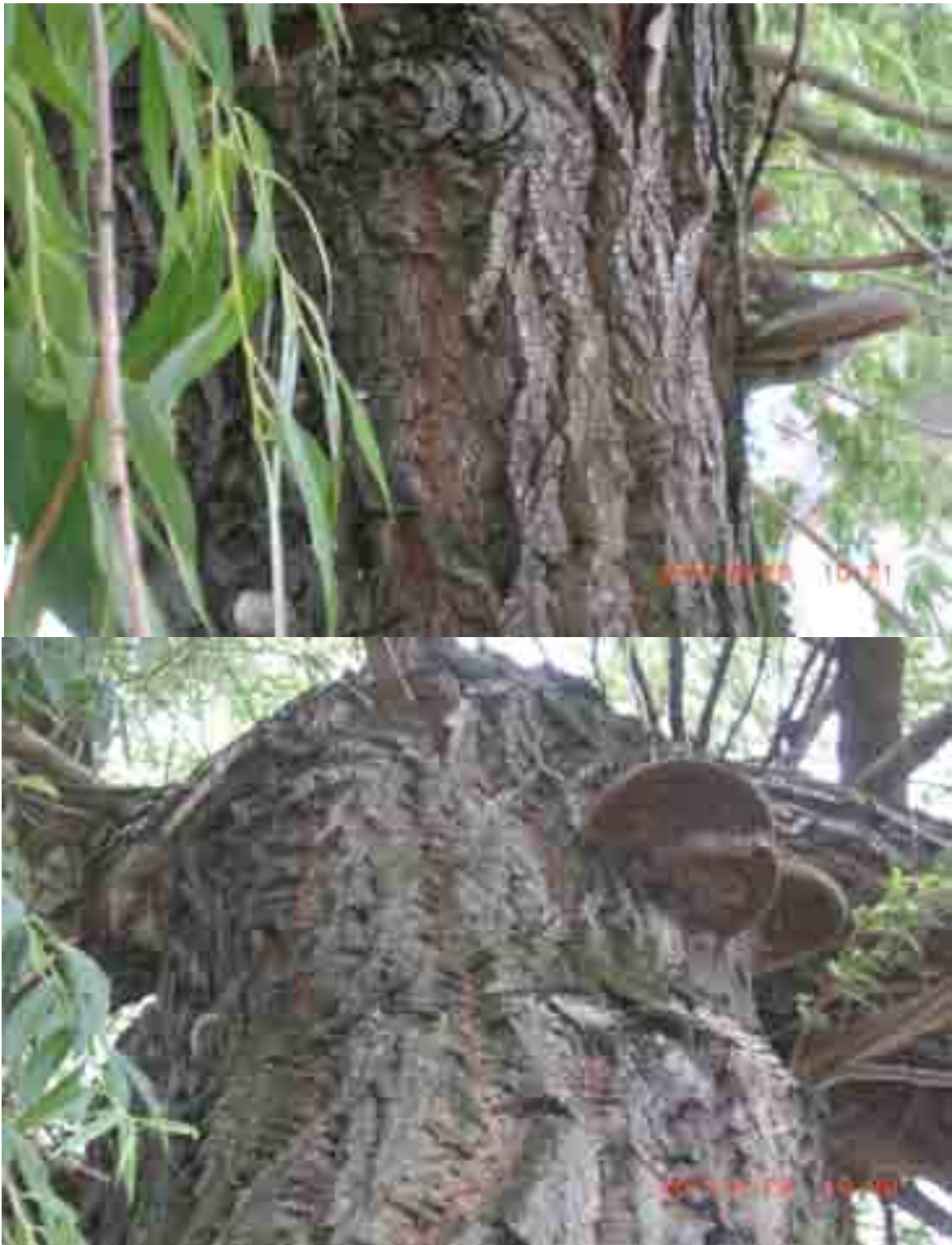
Abb.9+10: Pilzbefall an Nr. 12548