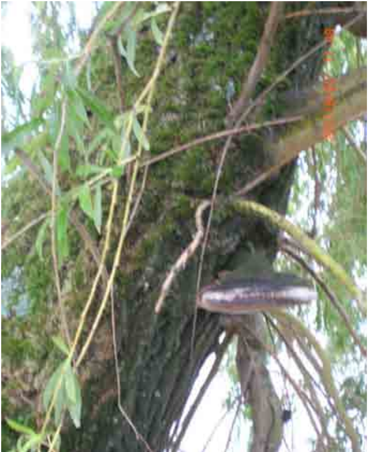
Abb.38: Feuerschwamm an Weide Nr. 12561