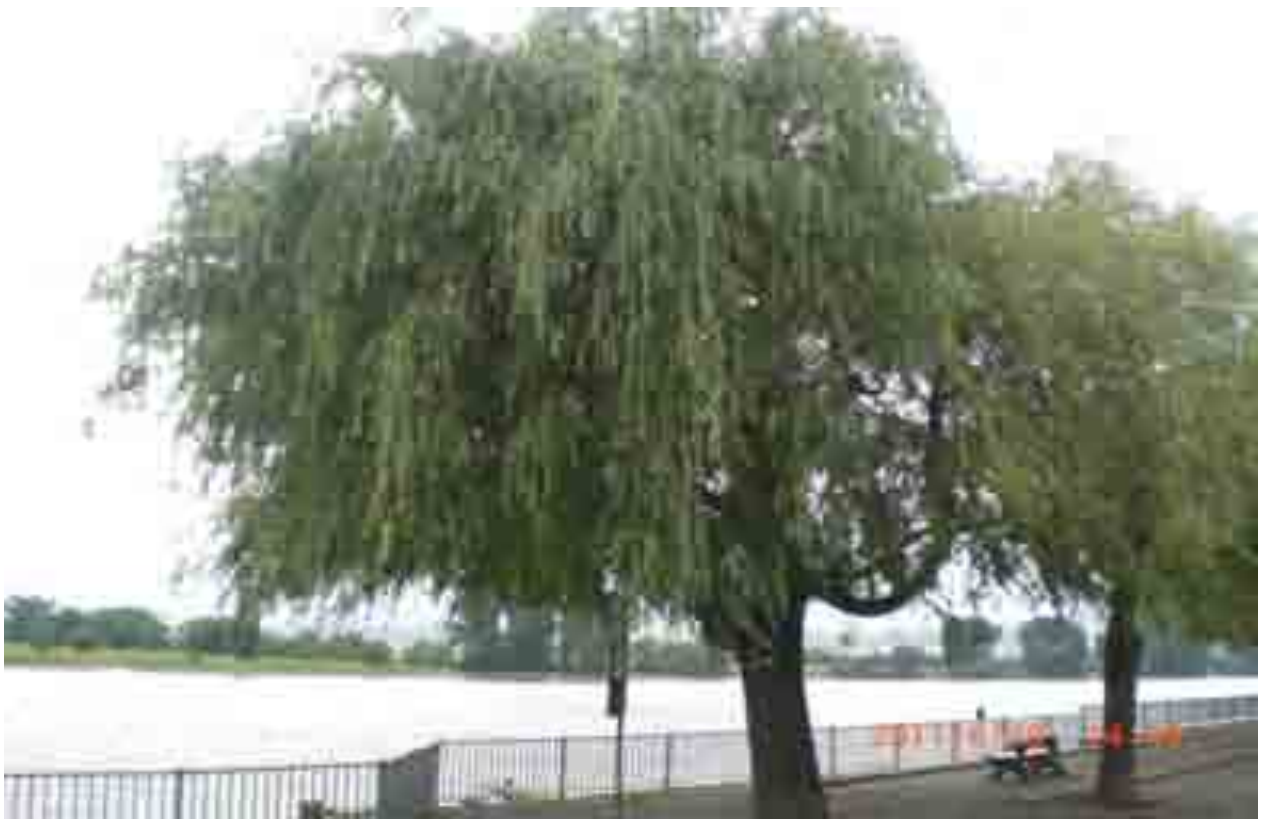
Abb. 30: Gesamtansicht der Weide Nr. 12558